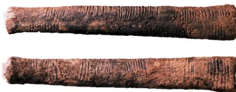
Figura 1: Duas Vistas do Osso de Ishango

Na Antiguidade muitos povos que estavam se estabelecendo viviam de atividades relacionadas à caça de pequenos animais e da extração de algumas raízes. Muitas dessas sociedades viviam em grandes espaços abertos das savanas da África, sul da Europa e na América Central. E como eles não se estabeleciam em um lugar fixo, os mesmos viviam como nômades e se deslocavam de um lugar para o outro a procura de alimentos e locais que permitiam eles se abrigarem com as variações climáticas. Esse período de locomoção contínua ficou conhecido como Período Paleolítico ou Antiga Idade da Pedra, (FERREIRA, 1984). A vida nesse período não teve um desenvolvimento como nos anos que se seguiram em algumas civilizações, pois a maior preocupação desses grupos era com a sobrevivência, não havendo assim progressos significativos de desenvolvimento devido às condições de vida que muitos deles viviam.