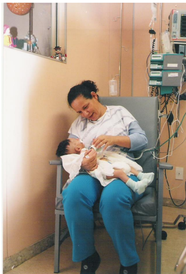
Foto 2 – Uma mãe cuidando de seu filho hospitalizado numa UTIP Cardiológica (Salvador-Bahia)

Diferentes pesquisas realizadas sobre a visão da família a respeito do atendimento prestado em UTIP, gradativamente, vão compondo o patrimônio informativo necessário a uma permanente revisão da assistência prestada, com vistas ao seu aprimoramento também no âmbito da Humanização Assistencial.