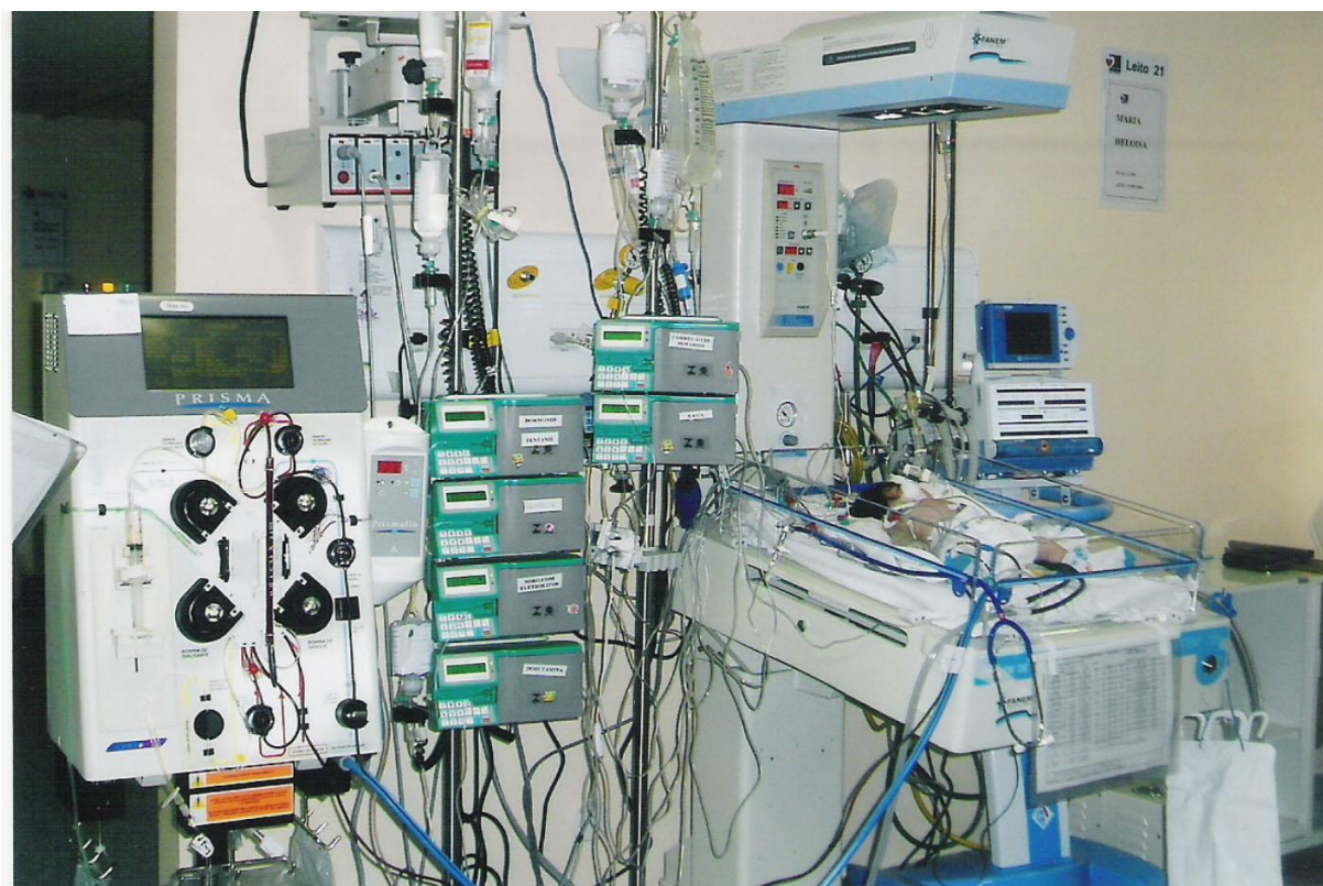
Foto 1 – Panorâmica dos equipamentos hospitalares – berço aquecido, monitor, sensores, máquina de hemodiálise, bombas de infusão e respirador – usados na UTIP do Hospital Ana Neri (Salvador – Bahia)

As unidades de Terapia Intensiva Pediátrica (UTIP), tanto quanto aquelas para uso de adultos, utilizam aparelhagem sofisticada eletrônica e de alto custo de aquisição e manutenção. (Figura 1)