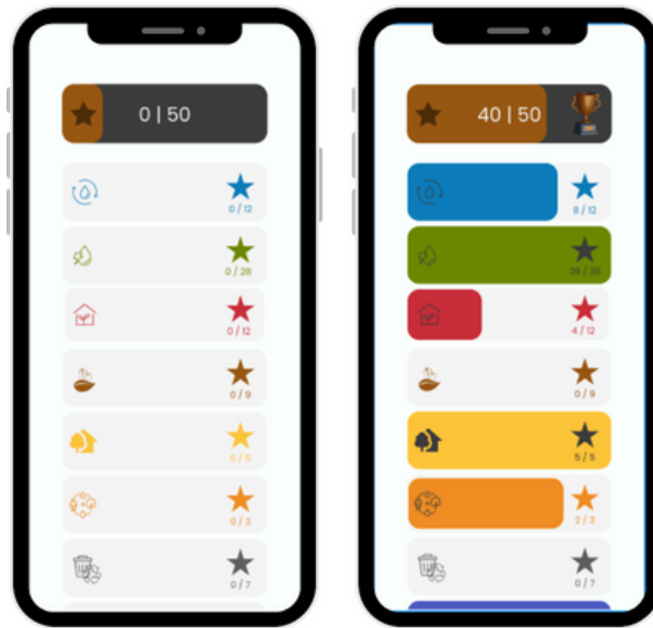
Figura 5 – Protótipo das telas das categorias.