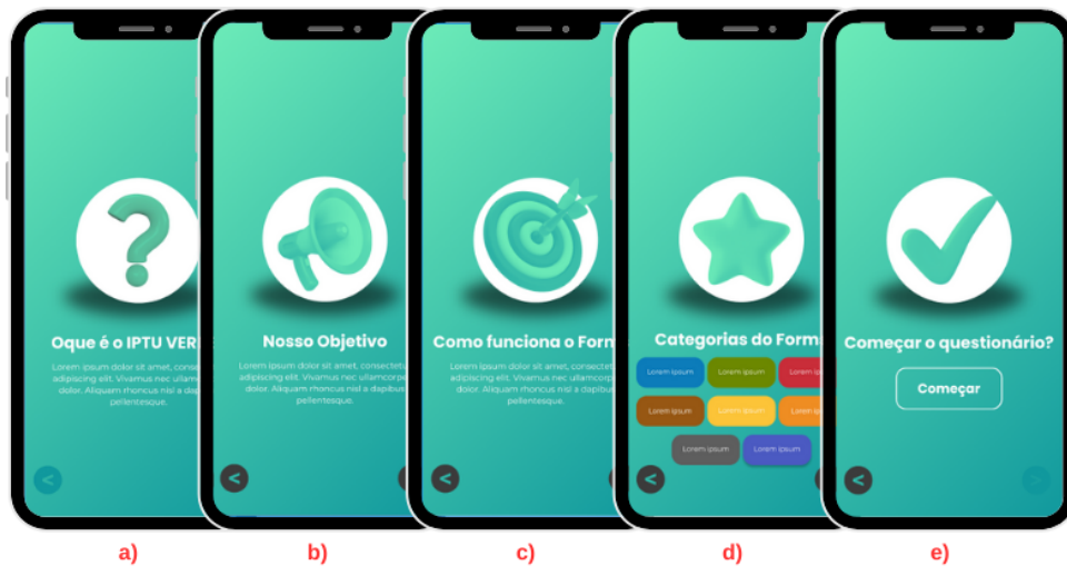
Figura 4 – Protótipo das telas do Onboarding .

As cinco telas iniciais (Figura 4), que introduzem o indivíduo sobre o projeto, seu objetivo e funcionamento, foram elaboradas integrando elementos textuais e não textuais para contextualizar o usuário ao aplicativo. Na tela "a)" da figura 4, apresentamos um breve texto explicando o que é o programa IPTU Verde. Em seguida, na tela "b)" da figura 4, descrevemos o objetivo do programa. A tela "c)" da figura 4 mostra como funciona o formulário, enquanto a tela "d)" da figura 4 apresenta as categorias. Finalmente, na tela "e)" da figura 4 há a opção de clicar no botão "Começar" para iniciar efetivamente o preenchimento do formulário.