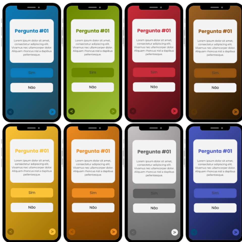
Figura 6 – Protótipo das telas das perguntas.