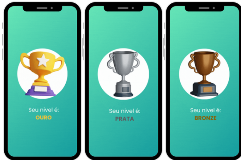
Figura 7 – Protótipo das telas de classificação.