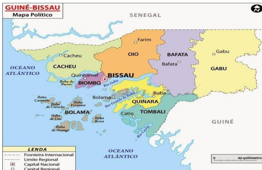
Figura 1: Mapa da Guiné-Bissau

O Governo considerou várias zonas de conservação dentro do território nacional, conhecidas como uma rede nacional das áreas protegidas com uma cobertura nacional de 12,2%, o que se eleva para 33,3%, na medida em que se tiver em conta a Reserva da Biosfera do Arquipélago Bolama Bijagós.