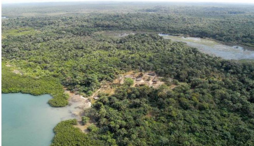
Figura 2: Arquipélago dos Bijagós

A maioria dos guineenses vivem segundo regras e princípios locais. As tradições das etnias têm uma ligeira diferença nomeadamente: a forma de celebração de casamentos, cerimônias fúnebres, pendor matriarcal ou patriarcal (se for matriarcal, quando os pais são da etnia diferente, os filhos seguem usos e costumes da etnia da mãe e o mesmo acontece no caso contrário).