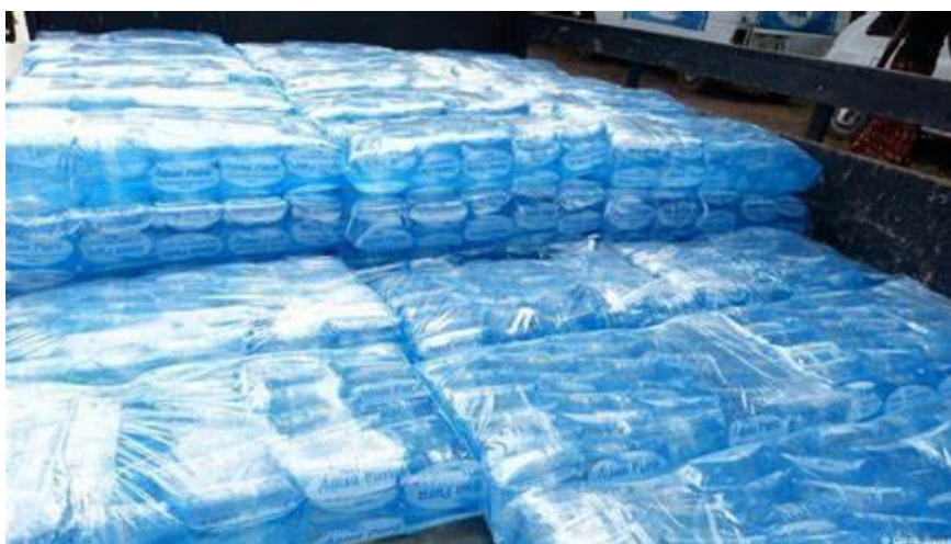
Figura 8: Sacos de plásticos.

O exemplo paradigmático é o Decreto Lei que proíbe a fabricação, comercialização e importação dos sacos de plásticos. Esse diploma legal existe desde 2013, mas o objetivo pelo qual foi criado continua, como se não houvesse nenhuma regulamentação. Para piorar, o fabrico e comercialização de água em pequenos sacos de plástico (500 ml) têm aumentado nos últimos anos de formas drástica, de modo que, até a presente data, são comercializadas e importadas no território nacional, perpetuando, assim, a perigosa poluição ambiental e causando muitos males aos diferentes ecossistemas.