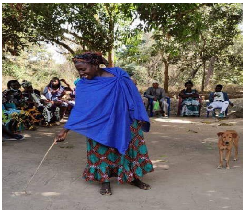
Figura 4: Mulher explicando como acontece a sucessão hereditária (acesso à terra) na sua etnia.

Em todas as classes, a lei se refere a ambos os sexos, como sucessíveis, não podendo ter o direito de propriedade sobre o solo. Por via da sucessão hereditária, a mulher deve sempre adquirir o direito de uso privativo da terra, desde que se respeite a ordem da classe dos sucessíveis. Tratando-se da Sucessão Legítima (ocorre quando o falecido não tiver disposto válida e eficazmente, no todo ou em parte, dos bens de que podia dispor para depois da morte, são chamados à sucessão desses bens os seus herdeiros legítimos).