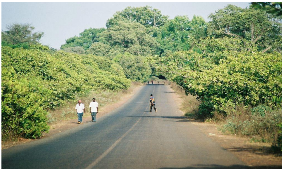
Figura 7: Mata ao redor da estrada que liga Bambadinca-Quebo (Região de Quínara e Bafatá).

Um dos principais problemas a se destacar é a aplicação deficitária de algumas leis e regulamentos ambientais; a realidade fática acaba não acompanhando os diplomas legislativos, aos quais devia seguir e respeitar.