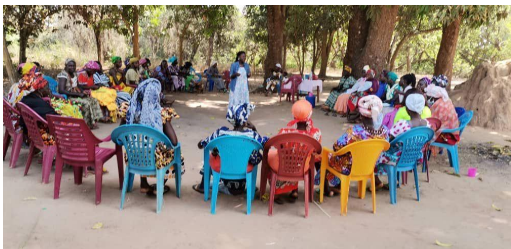
Figura 5: Reunião com as mulheres na tabanca 19 de Gã Mindjor, região de Quínara.

Na minha vivência como guineense e na minha experiência de jurista, atuei em comunidades no interior do país, ministrando formações sobre Direitos Humanos e Acesso à Justiça, por meio do projeto Mulheres Rurais, em muitas comunidades, o que me possibilitou conhecer de perto como sucede ali o acesso à terra.