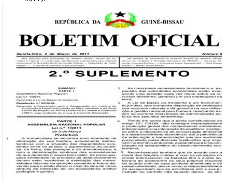
Figura 6: Boletim Oficial, 2011.

território. Conservação da Natureza - “é a gestão da utilização humana da natureza, de modo a viabilizar de forma perene a máxima rentabilidade compatível com a manutenção da capacidade de regeneração de todos os recursos naturais. Desenvolvimento Durável - é o desenvolvimento que satisfaz as exigências do presente sem comprometer a capacidade de futuras gerações satisfazerem as suas próprias necessidades ou o equilíbrio entre o uso durável dos recursos naturais e o desenvolvimento sócio-económico” (Guiné-Bissau, Lei de bases do Ambiente, p.1 2011).