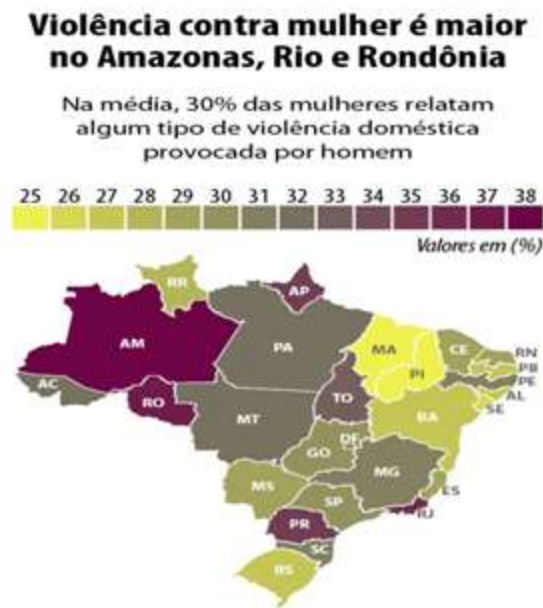
Figura 1 – Alto índice de violência contra a mulher no Brasil