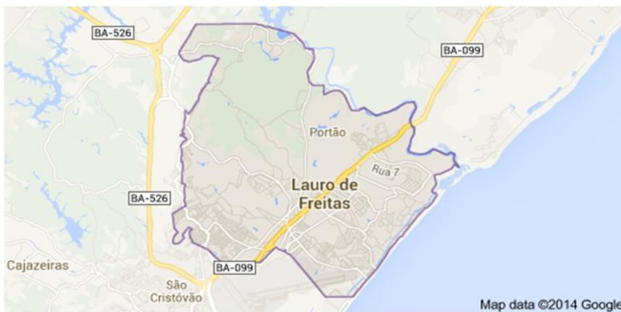
Figura 1: Localização de Lauro de Freitas

Lauro de Freitas é um dos dez municípios que integram a Região Metropolitana de Salvador (RMS), o município foi criado mediante a Lei de n.º 1753 de 27 de julho de 1962, sancionada pelo então governador do Estado da Bahia, Juracy Magalhães, em 31 de julho do mesmo ano, data considerada como criação da cidade. A figura 01 apresenta a localização e extensão territorial do município.