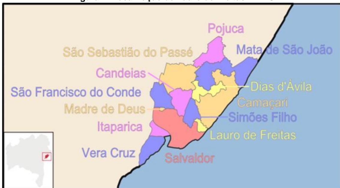
Figura 2: Localização de Lauro de Freitas – RMS