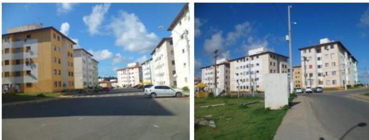
Figura 3 e 4: Imagens do Conj. Residencial D. Lindu