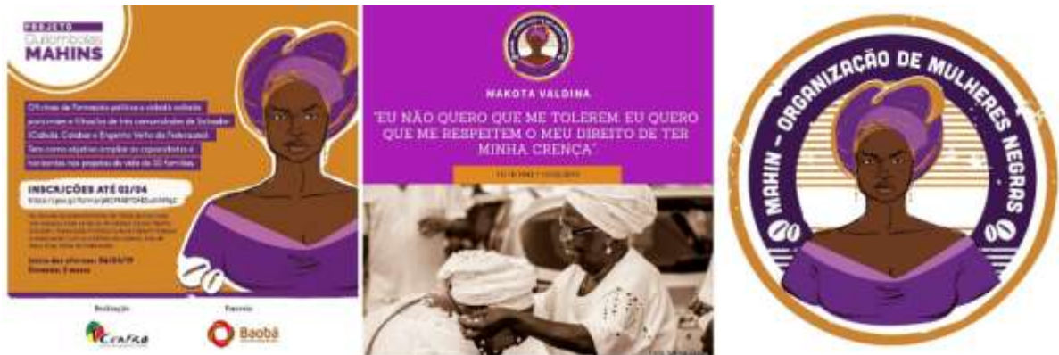
Figura 5 – Primeiras postagens da Negras Mahin.