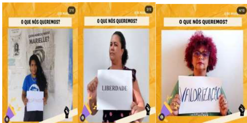
Figura 19 – Dia das mulheres 2 (Abayomi)

Se o primeiro card traz, ao mesmo tempo, uma provocação (O que falta?) e uma denúncia (as mulheres negras são desumanizadas), as demais imagens (10, no total), apresentam mulheres integrantes da Abayomi segurando cartazes. Em cada imagem, sob a pergunta “O que nós queremos?”, cada integrante apresenta sua resposta à pergunta (Figura 19).