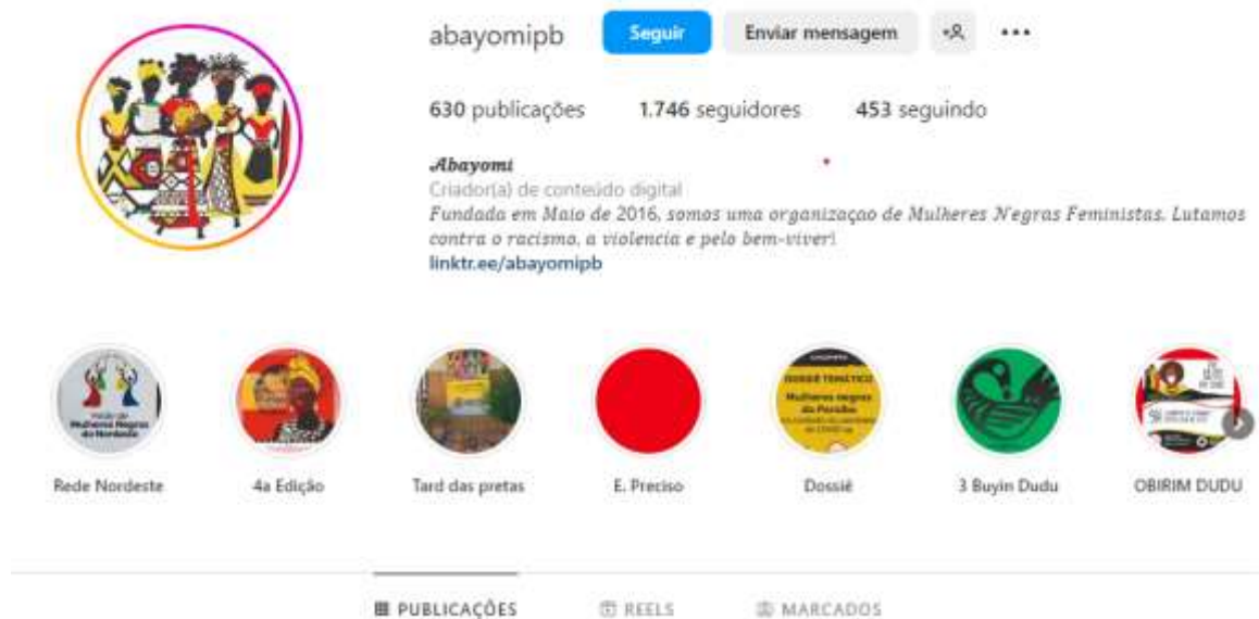
Figura 2 – Coletivo Abayomi (Instagram).