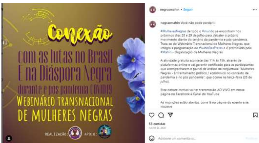
Figura 26 – Webnário de mulheres negras