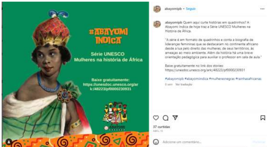
Figura 14 – Abayomi indica (I)

Associamos, nessa perspectiva, as postagens apresentadas pelas referidas Coletivas, nas quais se destaca o protagonismo feminino, à perspectiva de que essas postagens, em conjunto, ao apresentarem saberes emancipatórios, indicam às mulheres caminhos de criticidade e empoderamento. Nesse sentido, propiciam tanto uma reflexão em perspectiva política, identitária e/ou estético-corpórea, conforme se dividem os saberes emancipatórios (GOMES, 2020), como também impulsionam, indicam, visibilizam às mulheres negras caminhos e perspectivas de que construam realidades outras. Esse viés pode ser percebido também nos posts da Coletiva Abayomi, nos quais reproduzem a hashtag #abayomiindica, isto é, a partir do linguajar próprio às redes, a Coletiva indica leituras, filmes, dicas culturais que se relacionem aos temas abordados por essa organização, no tocante à vida e às experiências de mulheres negras (figuras 14 e 15).