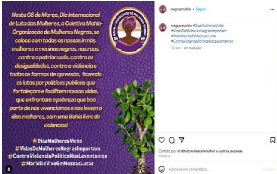
Figura 22 – Dia das mulheres (Negras Mahin)