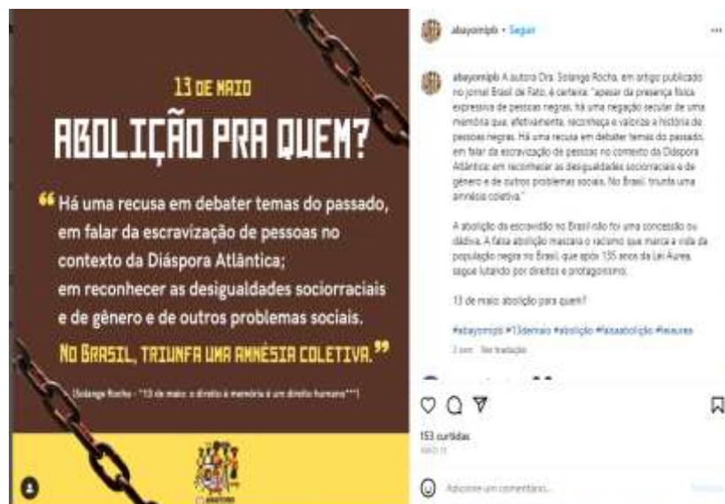
Figura 10 – Abolição para quem?

A postagem, tanto no que concerne à imagem de Zumbi e Dandara, quanto no texto verbal apresentado, busca trazer saberes que emancipam, ao apresentar essas duas figuras históricas como ícones de resistência do povo negro. Essa ideia de resistência e emancipação, da busca pela liberdade, bem como de reflexão pela atual condição das pessoas negras, também foi retratada pela Coletiva Abayomi, (Figura 10).