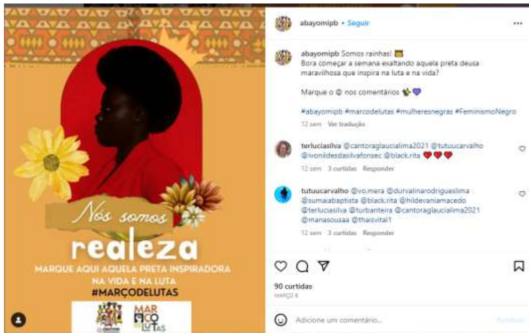
Figura 21 – Mês das mulheres 2 (Abayomi)