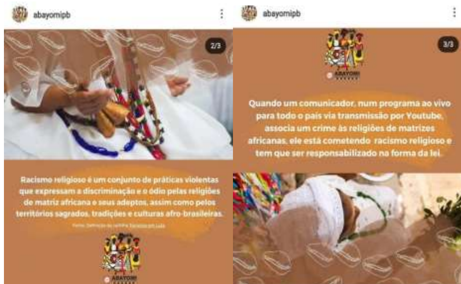
Figura 17 – Racismo religioso (II)