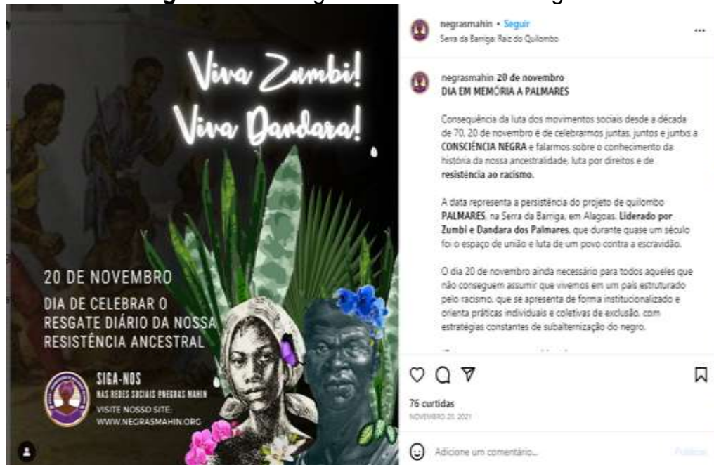
Figura 9 – Postagem da Consciência Negra