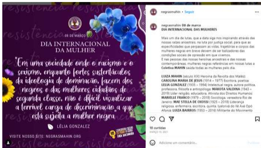
Figura 23 – Dia das mulheres (Negras Mahin)