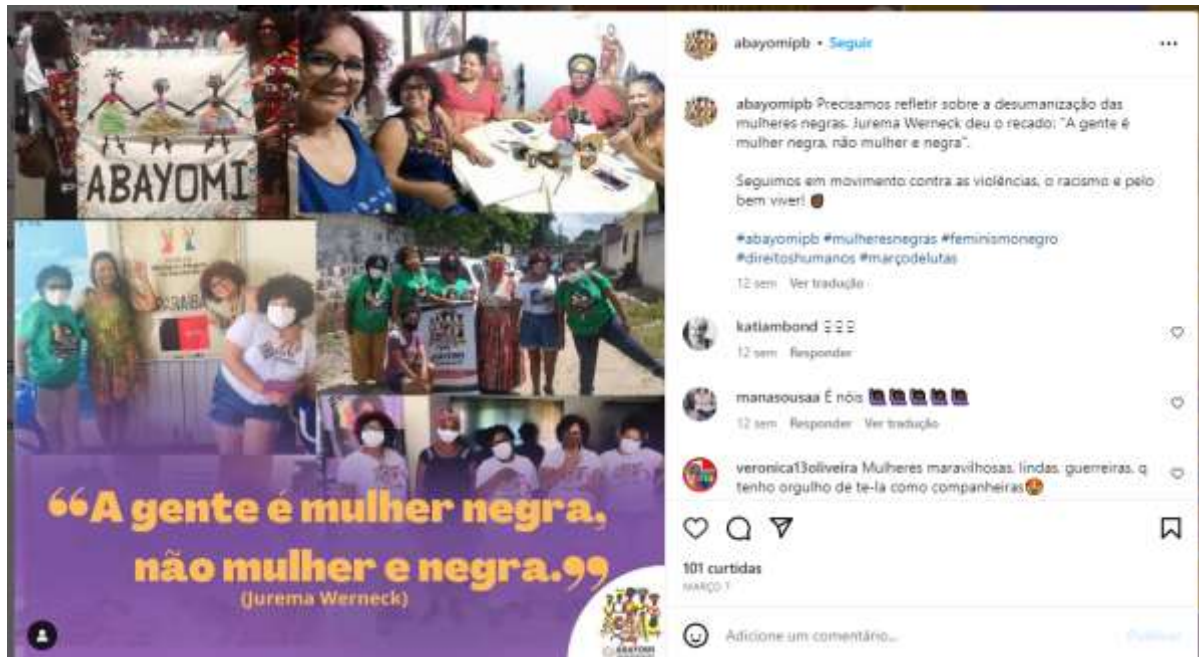
Figura 20 – Mês das mulheres (Abayomi)

realizadas ambas no mês de março, dedicado às mulheres, podemos perceber a interseccionalidade entre tais práticas, epistemologias e vivências (presenciais e virtuais).