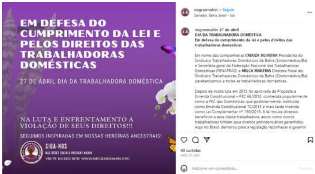
Figura 11 – Direitos das domésticas (1)

Fonte: Instagram da Coletiva Negras Mahin.