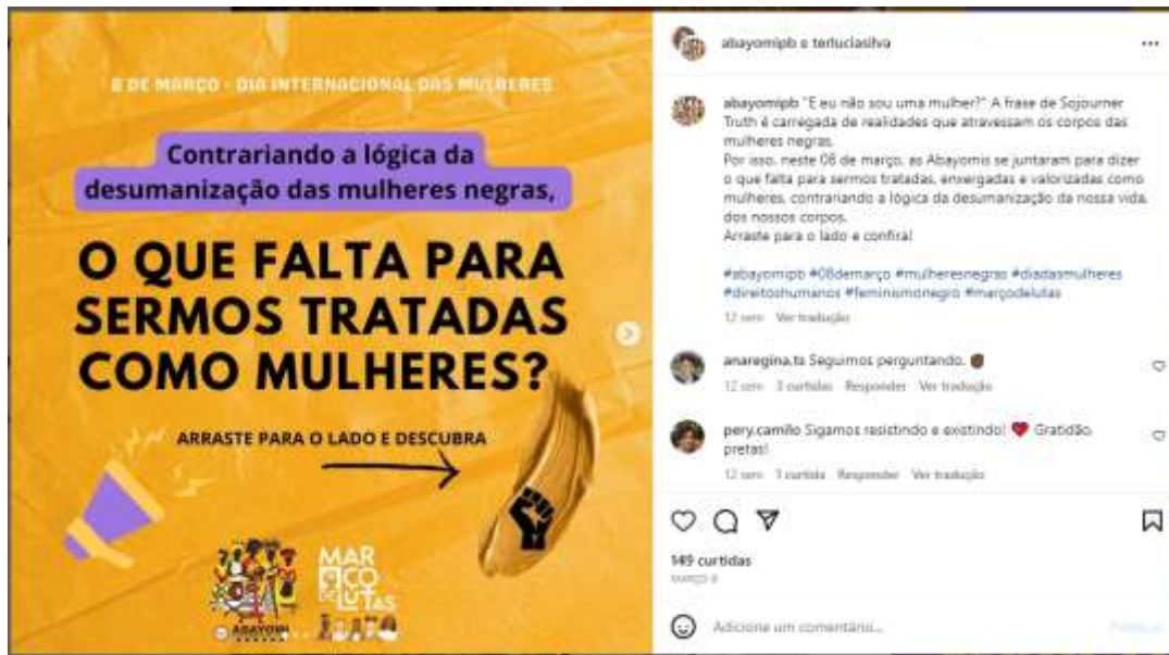
Figura 18 – Dia das mulheres (Abayomi)