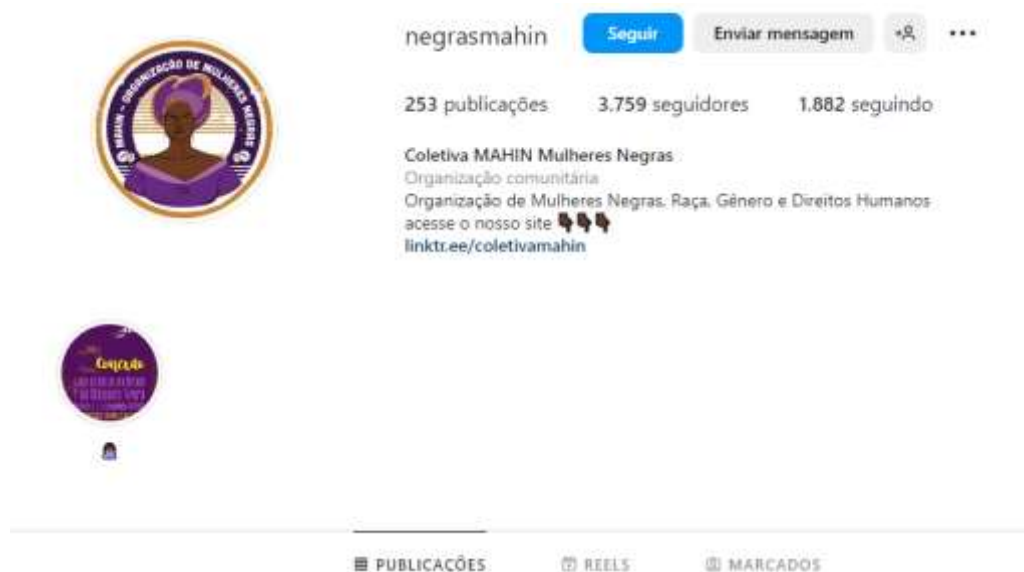
Figura 1 – Coletiva Negras Mahin (Instagram).

Por sua vez, a coletiva Abayomi (figura 2), também generificando a palavra coletivo, foi fundada e é protagonizada por mulheres negras, desenvolve suas ações em Campina Grande e região, na Paraíba, com perfis ativos no Instagram e Linktree . O nome dessa coletiva refere-se à história da boneca Abayomi , de origem iorubá, que significa aquele(a) que traz felicidade e alegria.