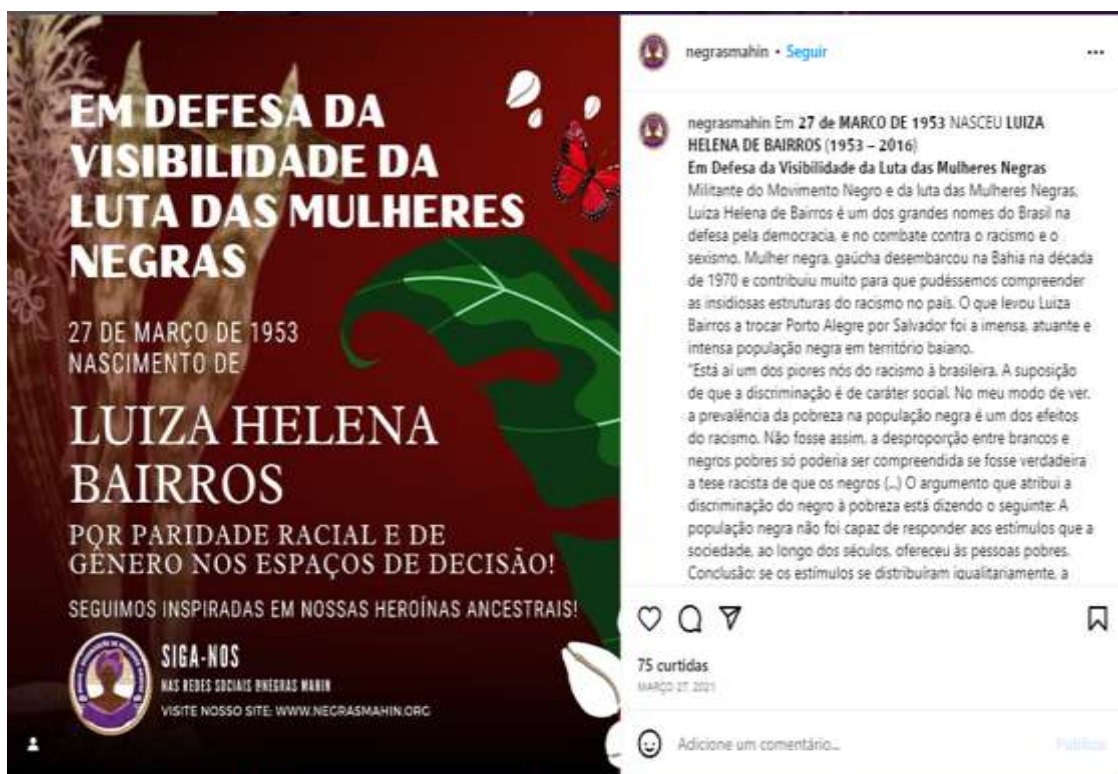
Figura 8 – Comemoração ao nascimento de Luiza Bairos (II)