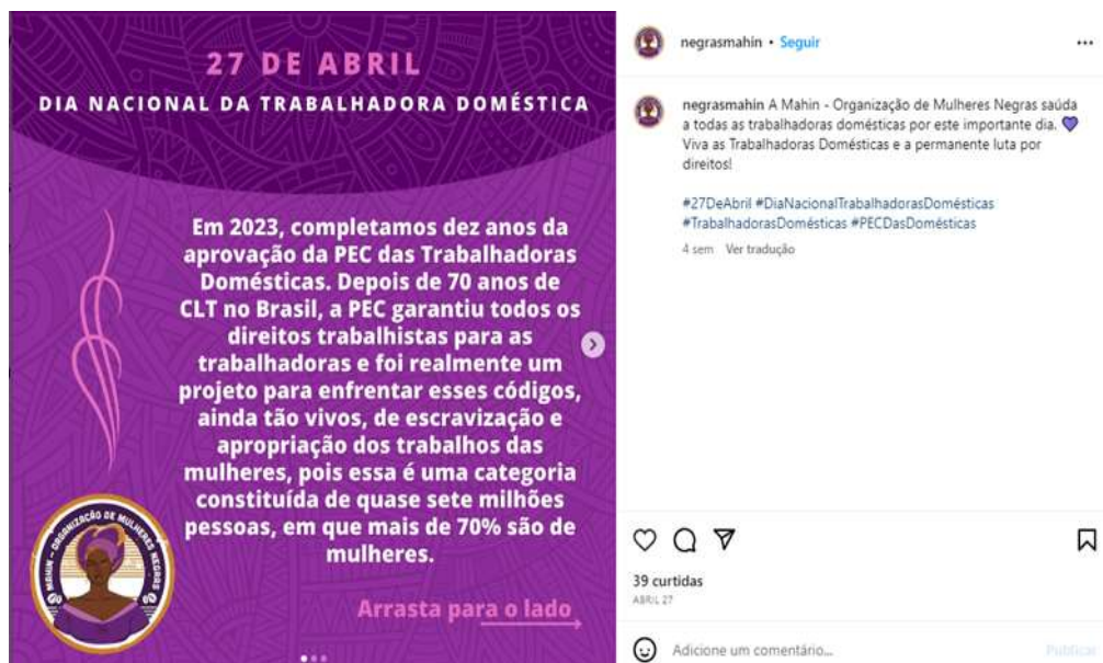
Figura 12 – Direitos das domésticas (2)