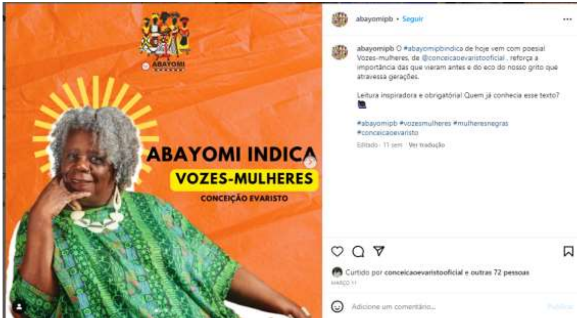
Figura 15 – Abayomi indica (II)