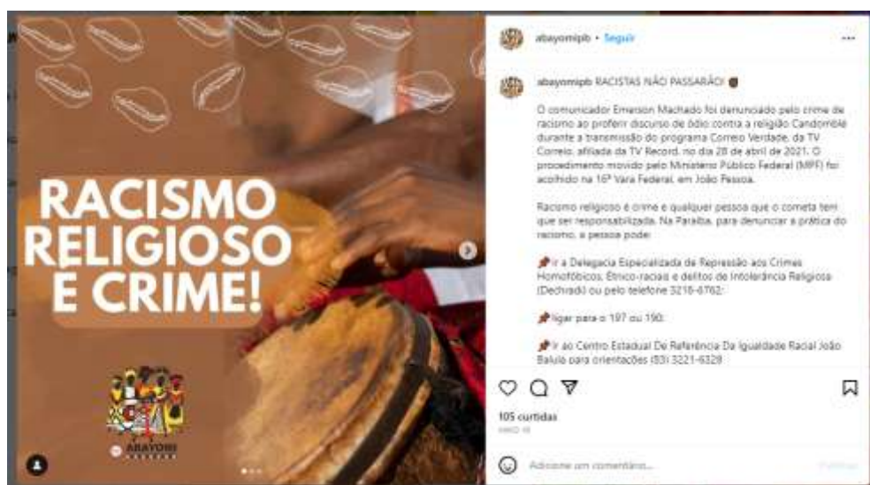
Figura 16 – Racismo religioso (I)

Frente a essas incertezas, que se acentuaram a partir de 2016, mas são históricas, as populações negras praticantes do candomblé e da umbanda, por exemplo, têm sido constantes alvos do racismo, da intolerância religiosa. Entretanto, muitas pessoas que sofrem com isso sequer sabem que são vítimas de um crime. Desse modo, postagens como as das figuras 16 e 17 são muito importante, dado que possibilitam uma instrumentalização quanto ao conhecimento sobre racismo religioso e a indicação de quais caminhos seguir para a denúncia.