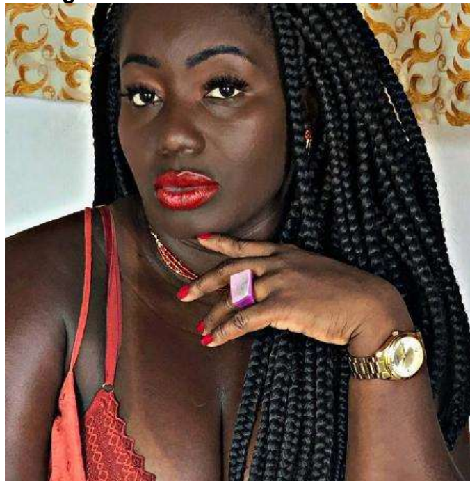
Figura 3 – A intelectual Carla Akotirene.