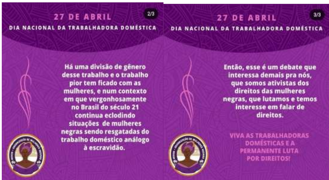
Figura 13 – Direitos das domésticas (3)