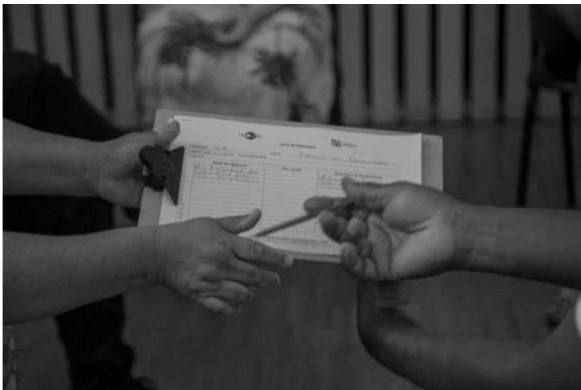
Registro Fotográfico de lista de presença da Reunião com Famílias – NCN Orquestra Castro Alves – NEOJIBA/2022

Dedico este trabalho a todas as famílias que fazem parte do programa NEOJIBA. Em agradecimento pelo respeito, admiração e confiabilidade depositada em todas as equipes de trabalho que integram o programa.