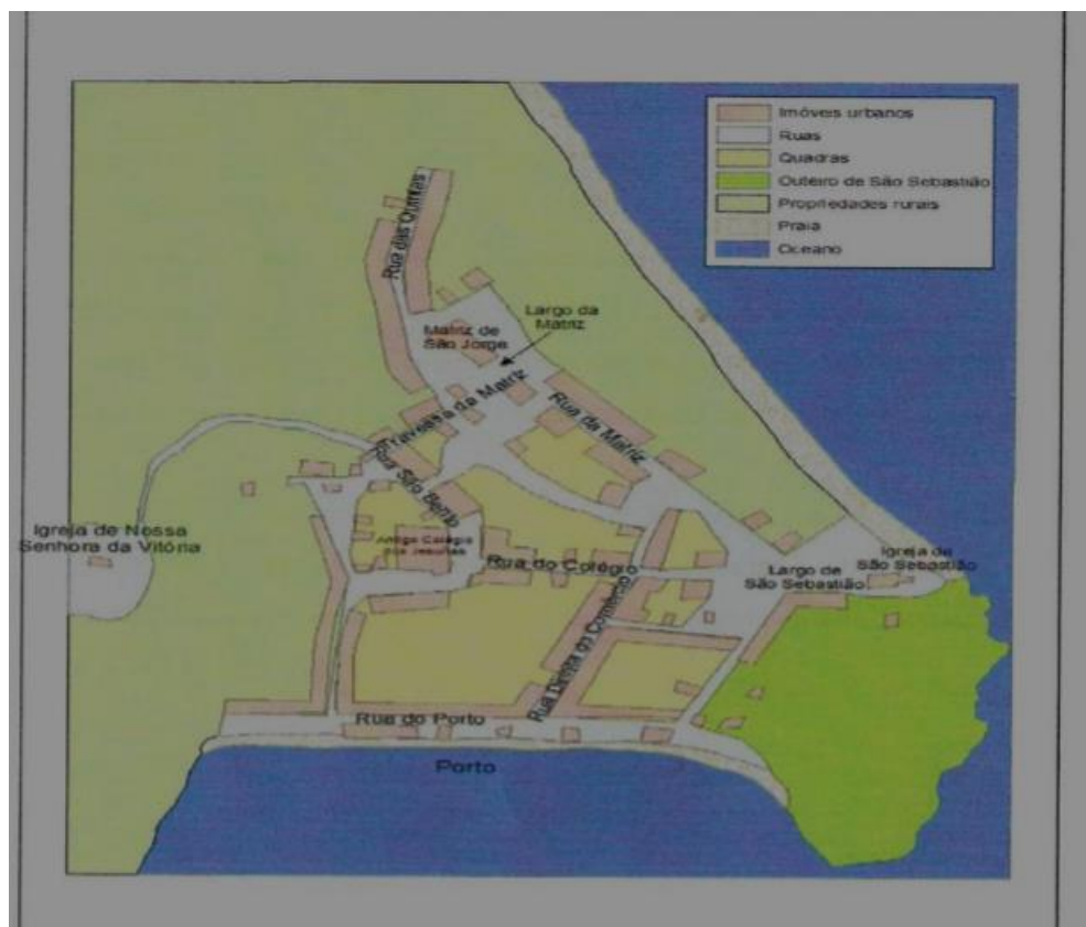
Imagem 01 – Principais ruas da Vila de São Jorge dos Ilhéus, 1852

De outro modo, as histórias que têm como cenário o espaço urbano transcorreram nas ruas da Vila. Entre os endereços mencionados estão principalmente, a Rua do Porto, a Direita do Comércio e o Pontal. Para ter uma visão mais aproximada dos locais em que essas histórias se desenvolveram apresento um mapa (Imagem 01) elaborado por Juliana Silva Habib (2006), no qual é possível ver as principais ruas da Vila em 1852.