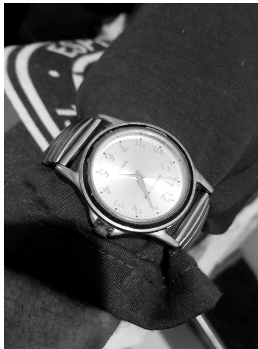
Figura 2 - Relógio no pulso de um dos residentes da ILPI