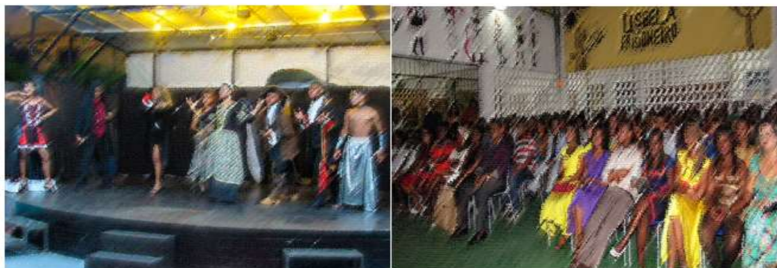
Figura 6 - Público na 8ª edição do Baile Literário 18

Ações educativas com propostas culturais e sociais configuram uma forma agradável na transmissão do conhecimento e compartilhamento de experiências. Para os alunos, o Projeto do Baile Literário atraía porque criava uma grande expectativa ao longo do ano para pôr em prática ideias criativas, manifestações artísticas de acordo com suas competências e vivências. Uma escola alegre e acolhedora, em que haja compreensão do outro, o espírito de solidariedade e a empatia que é o desejo de todos.