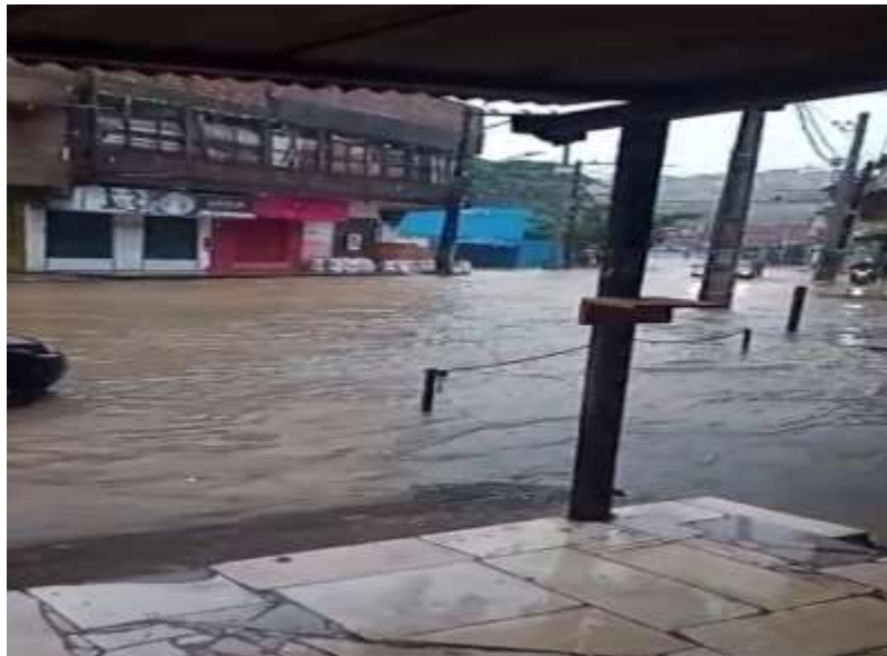
Figura 3 - Rua Joanes Centro Oeste – Prainha do Lobato, acesso principal em dias de chuva forte

funcionários da escola como as das ruas extremamente alagados em dias de chuva forte, conforme figura 3 e figura 4.