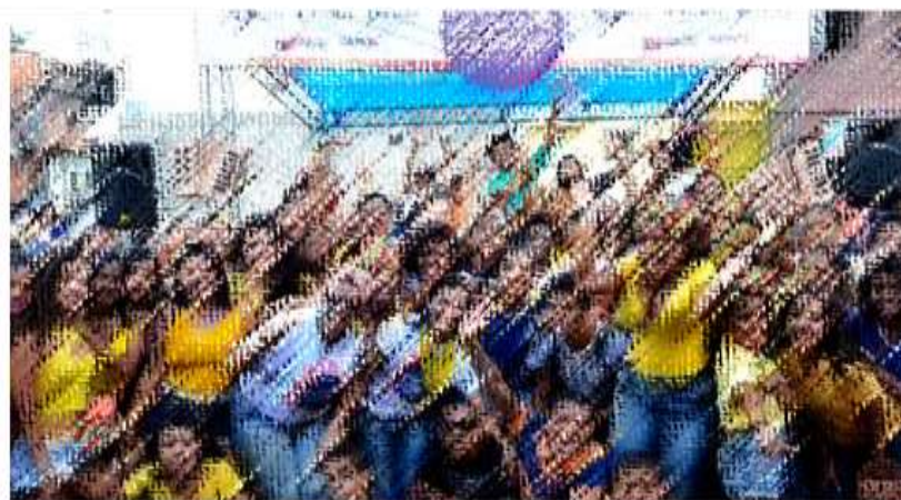
Figura 7 - Encerramento Projeto "Tô ligado na energia" no C.E.D.M.