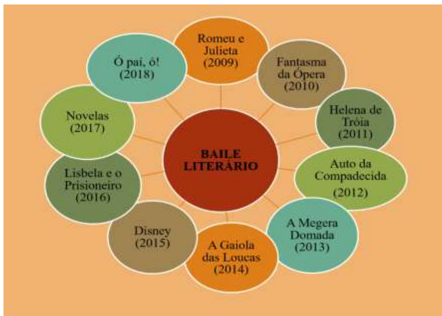
Figura 1- Edições do Baile Literário realizadas no CEDM

educandos letrados, premissas que não podem faltar no Projeto Político Pedagógico, cumprindo, portanto, a função social da escola.