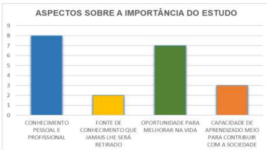
Gráfico 2 – Aspectos sobre a importância do estudo

Todos os participantes, conforme gráfico 2, consideram o estudo como base fundamental para obtenção do conhecimento, realização pessoal e profissional. Por meio do estudo, encontram oportunidades para buscar melhores condições de vida, tornarem-se cidadãos conscientes de seus direitos e deveres. Contribui com a transformação das pessoas dando-lhes possibilidade de traçar e tornar real um projeto de vida que lhes garantam fazer parte daqueles que conseguem desenvolver-se na sociedade com qualidade e segurança, direitos de todos.