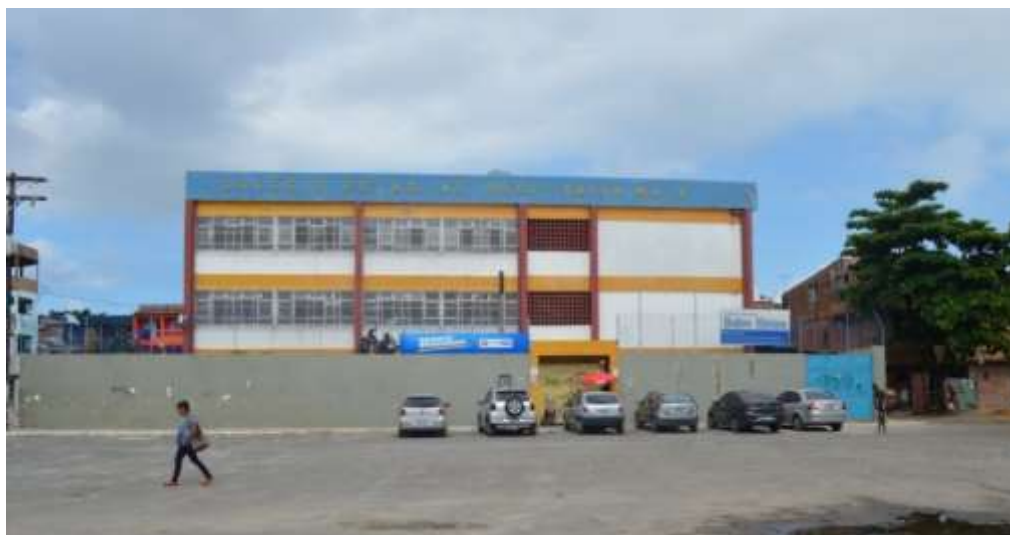
Figura 2 - Frente do CEDM

Salvador, margeando o centro urbano, inserida num contexto social que requer a atenção do estado para atender as diversas demandas sociais necessárias para o bem-estar dos moradores.