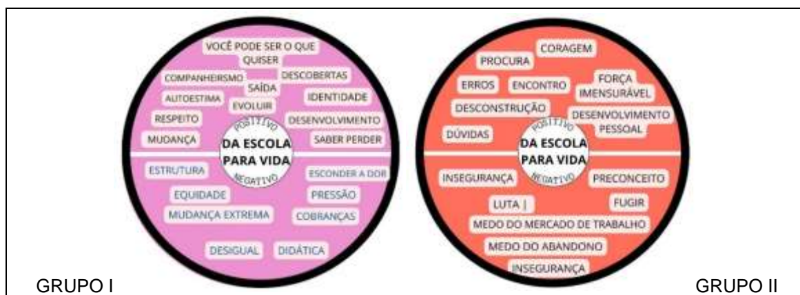
Figura 9- Reflexões: Da escola para vida

responsabilidade com a conclusão dos estudos e a possibilidade de tão logo ingressarem no mercado de trabalho.