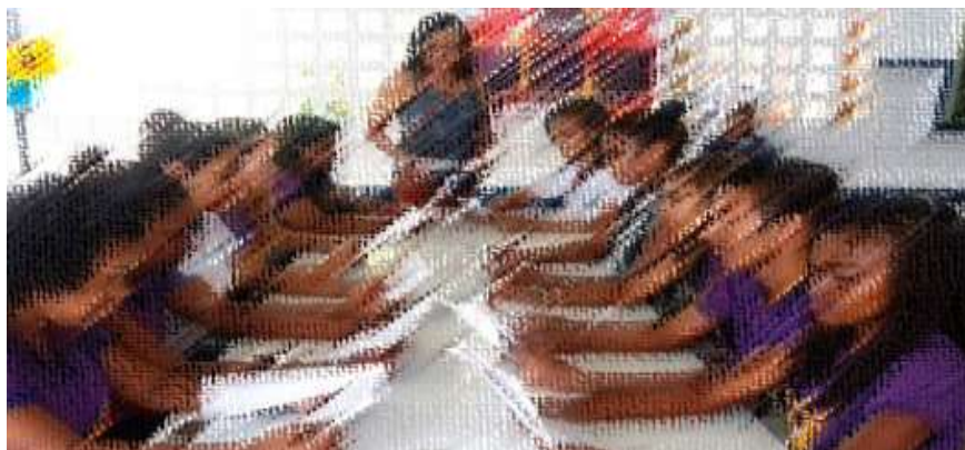
Figura 5- Momento de leitura coletiva no CEDM.

Os projetos interdisciplinares é uma importante ferramenta para desenvolver nos educandos a capacidade analítica e questionadora, necessária também para promover o letramento científico nas diversas áreas da aprendizagem.