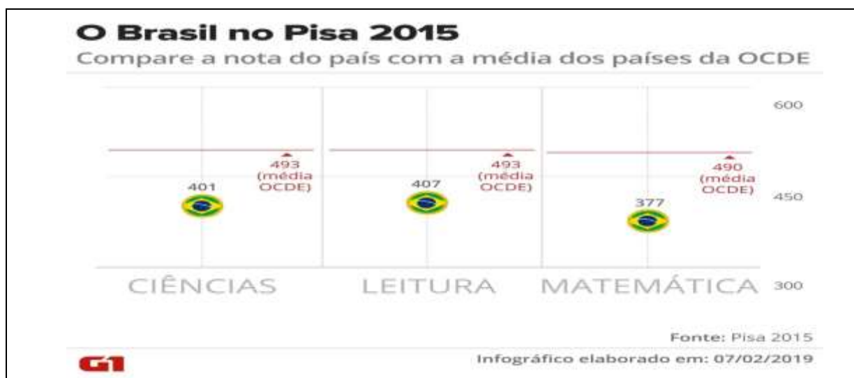
Infográfico 1 - Brasil – PISA - 2015