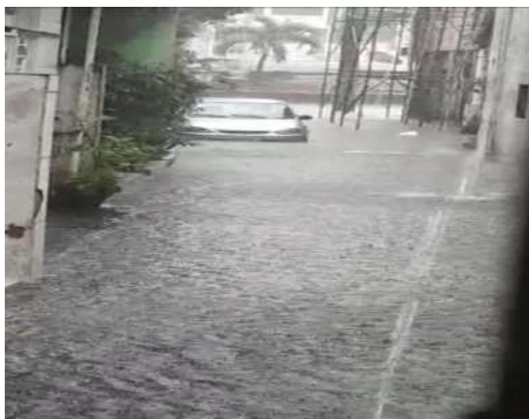
Figura 4 - Via transversal da rua Joanes Centro Oeste, Prainha do Lobato

Assim, como a maioria dos bairros das periferias do Brasil, a falta de oportunidade está evidente nas falas dos moradores da Prainha do Lobato e adjacências, quando questionados sobre a sua condição naquele território. Dos mais velhos aos mais novos que vão chegando, o desejo é o mesmo: ter