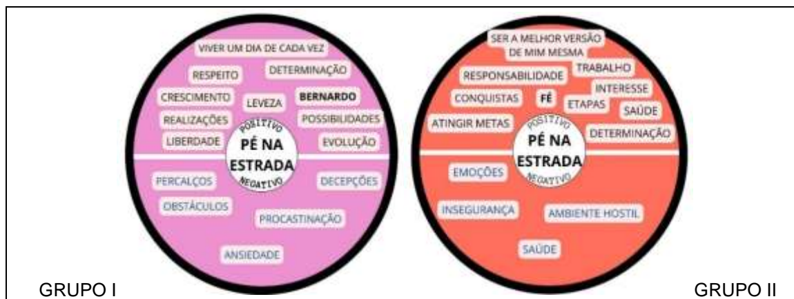
Figura 10 – Reflexões: Pé na estrada

Para colocar o pé na estrada, conforme figura 10, necessita saber que os riscos existirão e o enfrentamento é o caminho para acertar, errar, recomeçar até achar o prumo.