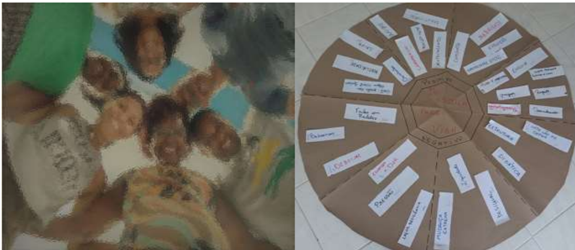
Figura 12- Roda de conversa – grupo 2