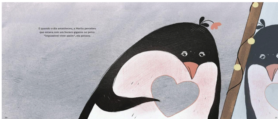
Figura 1: “Buraco” no peito.