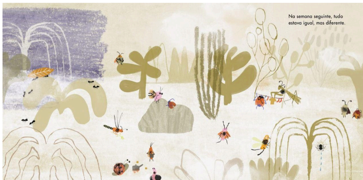
Figura 5: Reunião após perda da Lagarta.