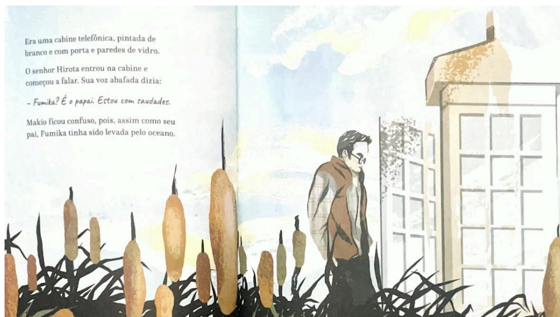
Figura 3: Construção da cabine telefônica.

A história se passa em um vilarejo no Japão, aonde grande parte da população vive da pesca, até que uma tragédia causada por um tsunami transforma a vida dos moradores. Diante das perdas, o protagonista, uma criança, chamada Makio, e outros personagens enfrentam a dor do luto. Nesse contexto, o senhor Hirota constrói uma cabine telefônica sem fio, destinada a permitir que os enlutados se comuniquem simbolicamente com seus entes queridos falecidos. Essa experiência proporciona um espaço de expressão e acolhimento, transformando a vivência do luto de muitos habitantes da vila, incluindo Makio, que encontra na cabine uma forma de expressar sua saudade e encontrar conforto diante da ausência.