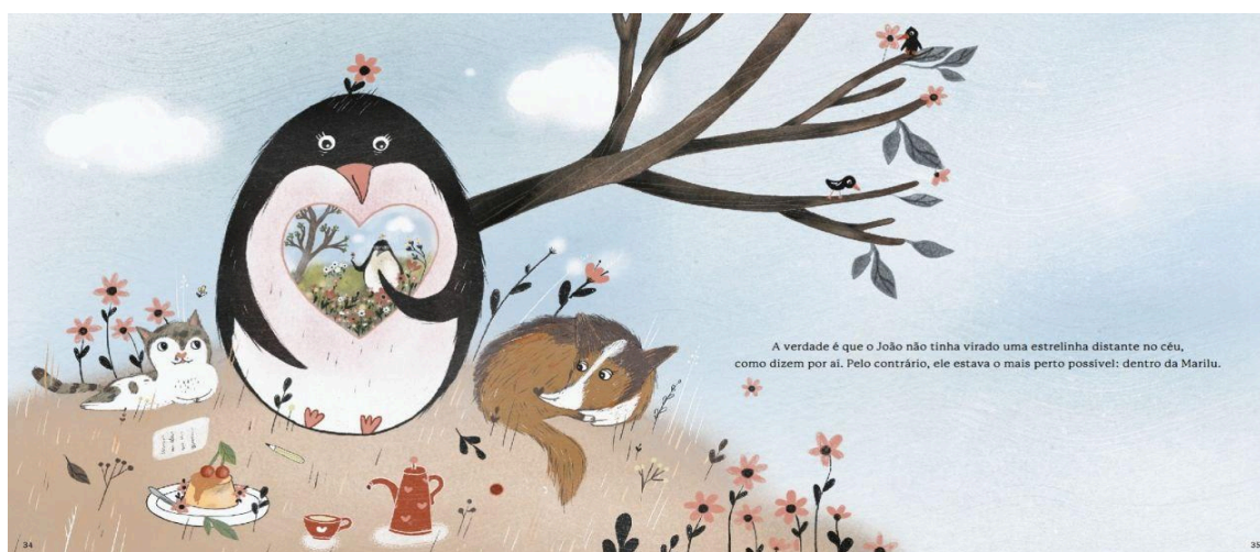
Figura 2: Espaço interno preenchido com lembranças.