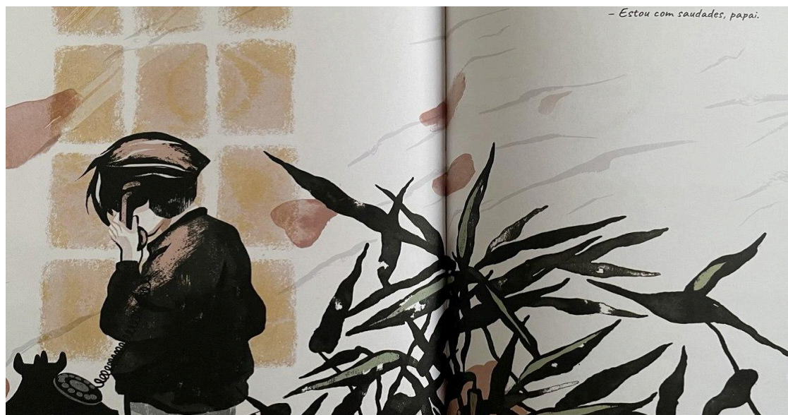
Figura 4: “Ligação” com entes queridos falecidos.