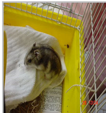
Figura 5 – Hamster de estimação, que atraiu e foi sugado pela L. cortelezzii