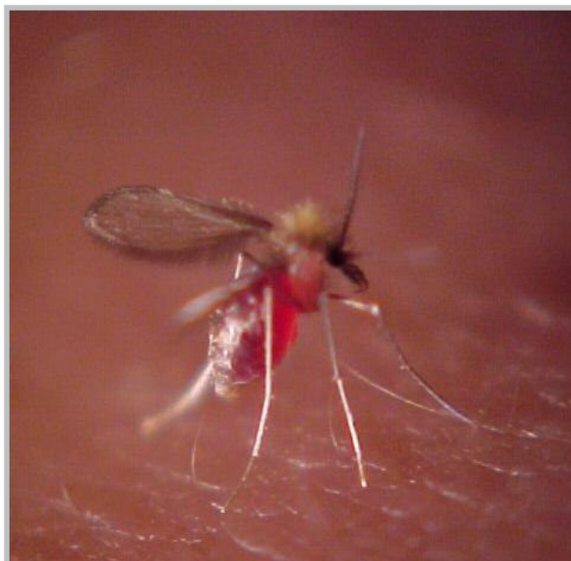
Figura 3. Lutzomyia cortelezii