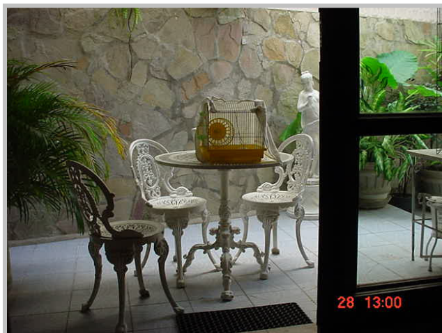
Figura 4 – Jardim interno, com gaiola de hamster de estimação, que atraiu e foi sugado pela L. cortelezzii