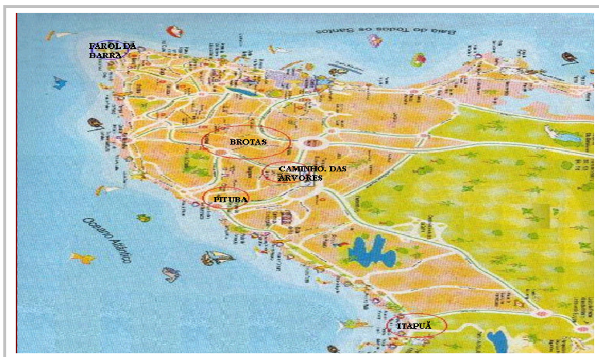
Figura 6. Mapa de Salvador