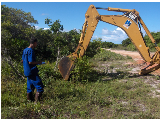
Figura 3 – Resgate com máquina de Myrcia sp.

O resgate e salvamento das plantas, com altura variando entre 0,8 e 2 m, é realizado com o auxílio de máquina retroescavadeira (Fig. 03 e 04). Os funcionários que fazem resgate com máquina também receberam treinamento específico para execução do trabalho.