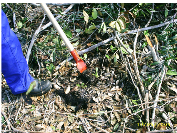
Figura 1 – Resgate manual de Inga fagifolia

O resgate e salvamento manual (Figura 1 e 2) consistem em fazer o arranquio das espécies herbáceas e plântulas com a utilização de cavadores e enxadetas, mediante treinamento prévio da equipe de resgate e adequação das técnicas de arranque. Após o resgate manual, é iniciado o resgate com máquinas.