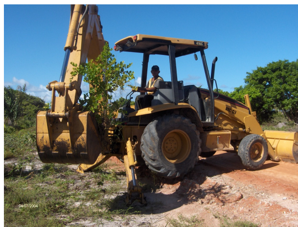
Figura 4 – Resgate manual de Myrcia sp.