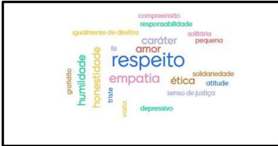
Figura 2. Nuvem de Palavras: Valores

Vejamos a nuvem de palavras construída a partir das respostas dos estudantes: