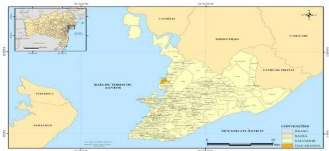
Figura 1. Localização do bairro de Itacaranha

Na figura abaixo, é possível localizar o bairro de Itacaranha em Salvador; é um componente de grande extensão no Subúrbio ferroviário da cidade.