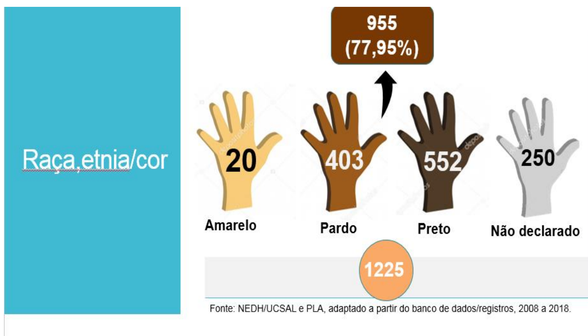
Figura 2 – Composição étnico-racial de integrantes do Projeto

Outros dados captados através dos informes internos do PLA, para o decênio 2008-2018, também revelam o olhar sobre as urgências e as ausências (Santos, 2009, 2012 e 2016). As relações familiares e conjugais apresentam-se com diversos detalhes como composição, rupturas e conflitos que podem ser motivações da “saída” de casa e ruptura de vínculos.