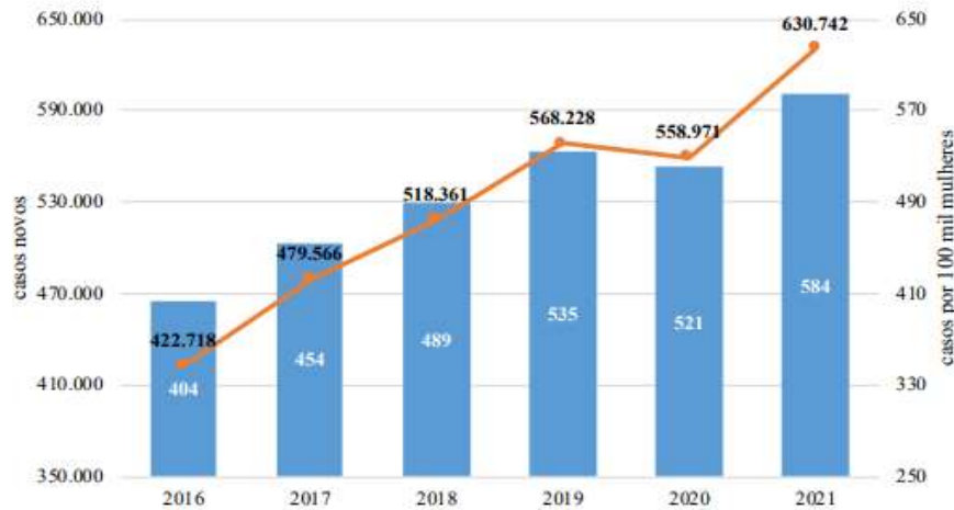
Gráfico 1: Número de casos novos de violência doméstica no CNJ – Brasil 2016-2021

Fonte: Monitoramento da Política Judiciária Nacional de Enfretamento à Violência contra as Mulheres; Conselho Nacional de Justiça.