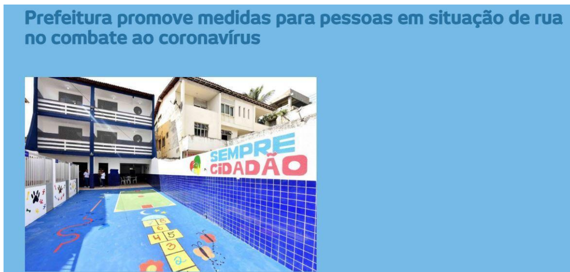
Figura 17 – Pessoas em situação de rua