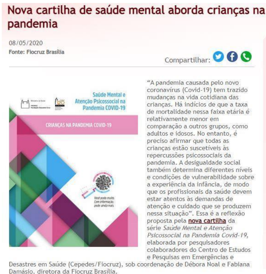
Figura 3 – Nova Cartilha de Saúde Mental