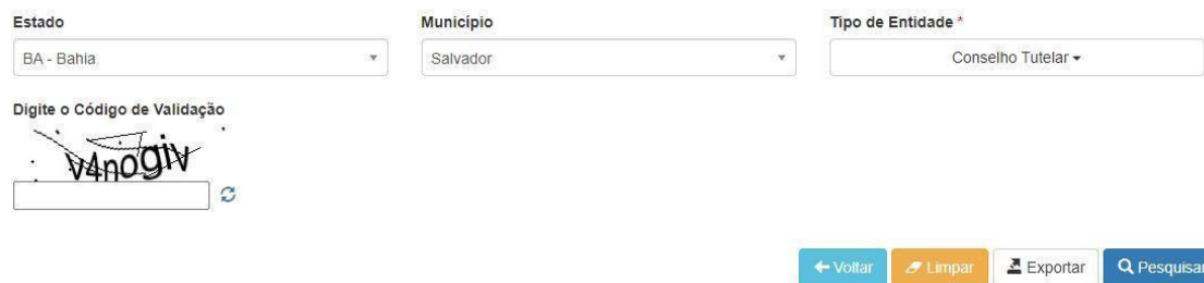
Figura 09