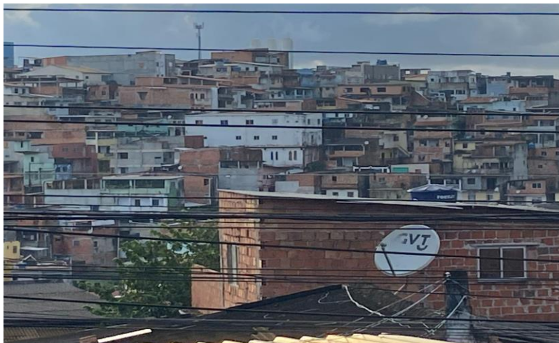
Figura 9 – Bairro Alto do Cabrito

Muito se debate sobre a violência doméstica, mas, para discutirmos sobre a temática na perspectiva das crianças e adolescentes iremos iniciar a análise pelo período anterior à crise sanitária acometida pelo vírus SARS-CoV-2, isso porque será necessário comparar os números que antecederam o ano da pandemia, de modo que poderemos trazer uma realidade do qual a sociedade pode ter passado despercebida sobre o crescimento. A violência doméstica tem copiosas formas de engendrar na sociedade, sendo praticadas sem que nunca fossem denunciadas.