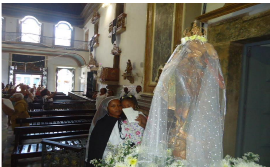
Figura nº 10- Tradição de Mãe para Filha