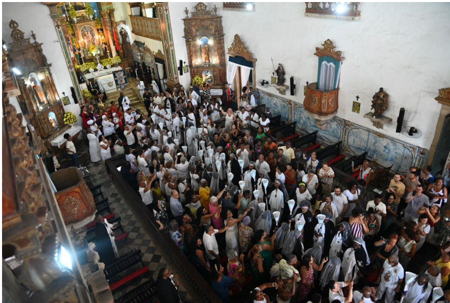
Figura nº 14- Visão panorâmica da Missa Festiva