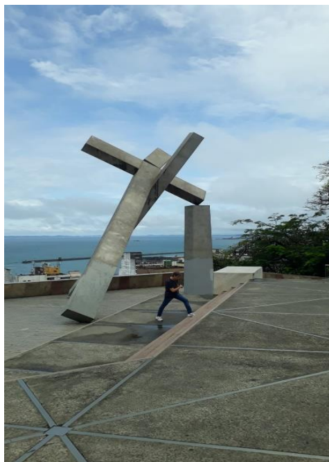
Figura nº 03 – Monumento da Cruz Caída

Igreja do Rosário, os irmãos se reuniam nos altares laterais de igrejas matrizes. Este local, hoje, guarda o Monumento da Cruz Caída 1 .