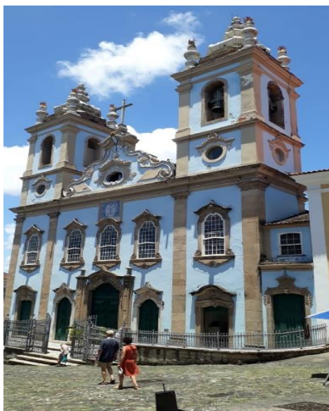
Figura nº 04 - Igreja do Rosário dos Homens Pretos

Fachada da Igreja do Rosário no Pelourinho-SSA-BA - 2024