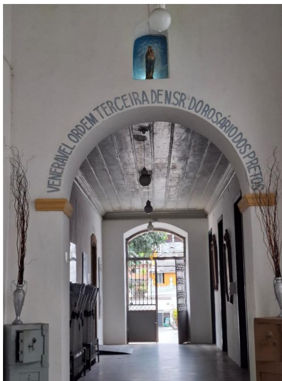
Figura nº 12- Acesso lateral da Igreja, com o nome Rosário dos “Pretos”

Os irmãos que são contra o ingresso de pessoas brancas alegam se tratar de uma Irmandade dos Homens Pretos, como o próprio nome enuncia. Ao serem questionados se havia alguma liderança em relação a esta proposta, disseram que desconhecem. Acrescentaram que o padre “P. L.” é favorável à proposta, mas acreditam que seja por questões religiosas, de acolhimento e, outros irmãos, que são minoria em termos numérico, considerando o quantitativo total de 250 irmãos inscritos, são favoráveis por interesses em fazer a Irmandade um produto negociável, o que a maioria discorda. Segundo Sr. “A. N”. , que é contrário, “tudo na Igreja do Rosário, construído pelos antepassados nos seus quatro séculos de história, tem um significado a ser salvaguardado, que diz respeito à nossa cidadania cultural e à população negra”.