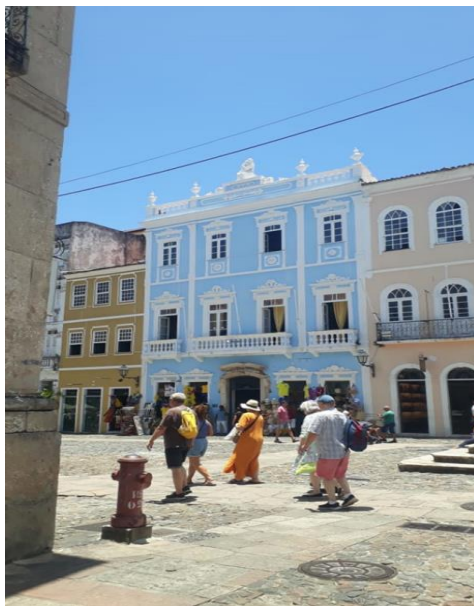
Figura nº 13- Fachada da Sociedade Protetora dos Desvalidos – Cruzeiro de São Francisco – Centro Histórico