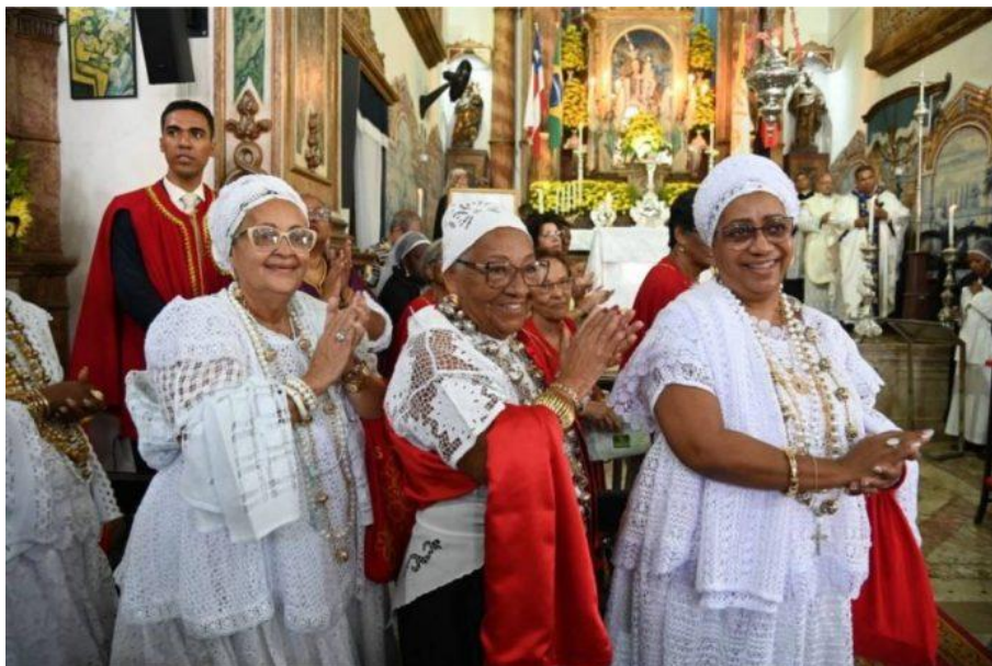
Figura nº 15- A Festa – Presença feminina e a dupla pertença

econômico, garantindo o recebimento de recursos do Estado para este fim e, portanto, retira a necessidade dos irmãos realizarem busca por doações.