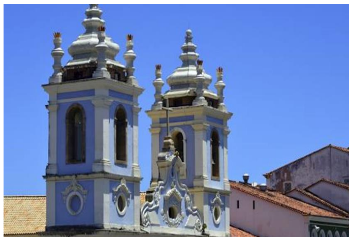
Figura nº 01 - Torres da Igreja do Rosário e os coruchéus