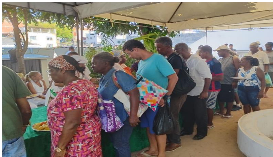
Figura nº 11- Festa na Irmandade – O prato bacalhau com toucinho é servido à população