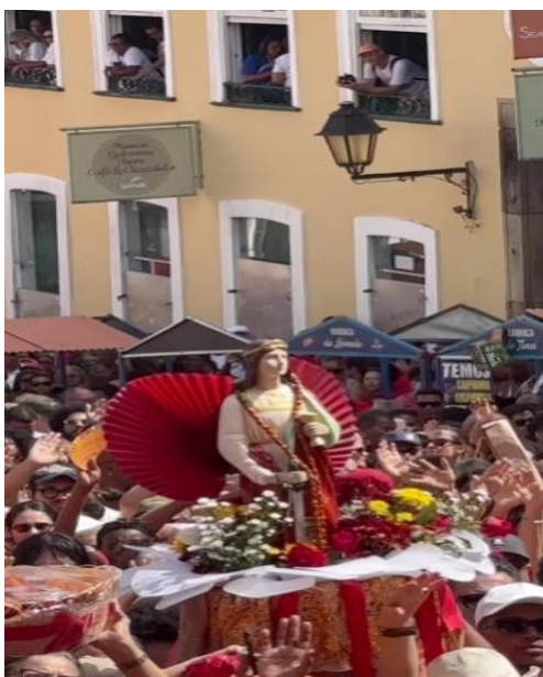
Figura nº 05- Festa de Santa Bárbara

Fonte: Marli Simões, Festa de Santa Bárbara – Iansã (2024). Abre o Calendário Festivo de Festas Populares em Salvador, com missa campal