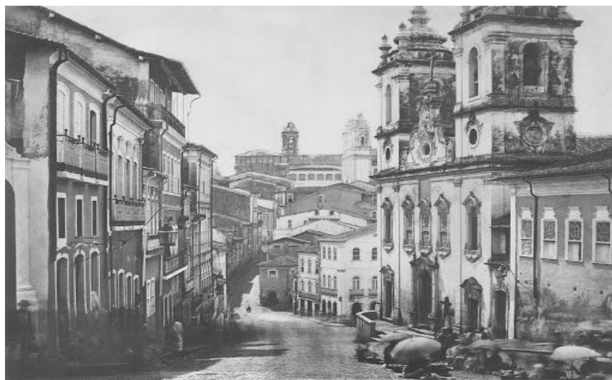
Pelourinho século XIX