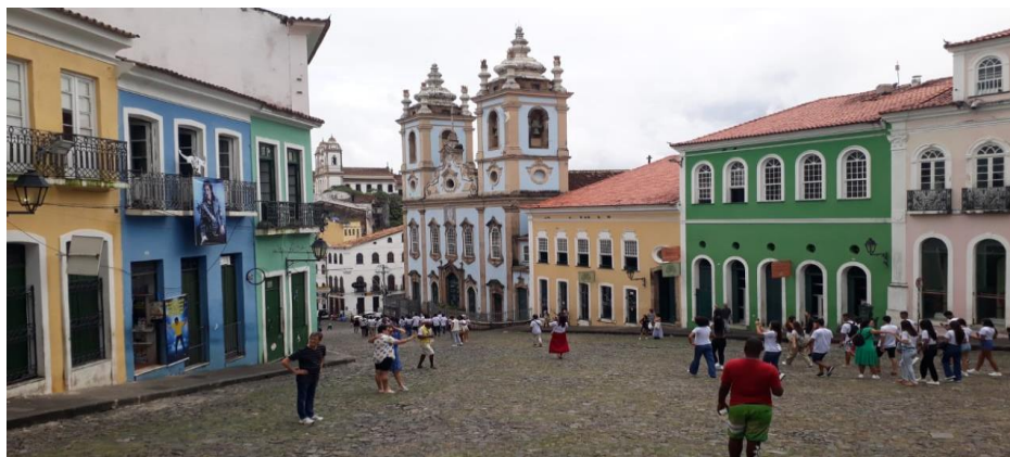
Figura nº 02 - Largo do Pelourinho, Sítio Jesuítico, ao centro a imponente Igreja do Rosário, azul como o manto de Nossa Senhora do Rosário

A Corôa Portuguesa e a Igreja Católica foram importantes aliados na época das grandes navegações, atuando no processo de expansão comercial e marítima das potências europeias. Não é desprezível o fato de que uma das principais razões da conquista e ocupação de novas terras foi a necessidade de expandir a fé católica, combatendo as heresias e religiosidades diversas. (Priori, 1994, p.81)