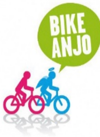
Figura 3 – Marca Bike Anjo

Sensibilizada com o que ouviu, refez o que me dissera acerca de que "todos aprendem na infância" e lembra da existência de um grupo voluntário que ensina pessoas, em qualquer idade, a andar de bicicleta: o Bike Anjo