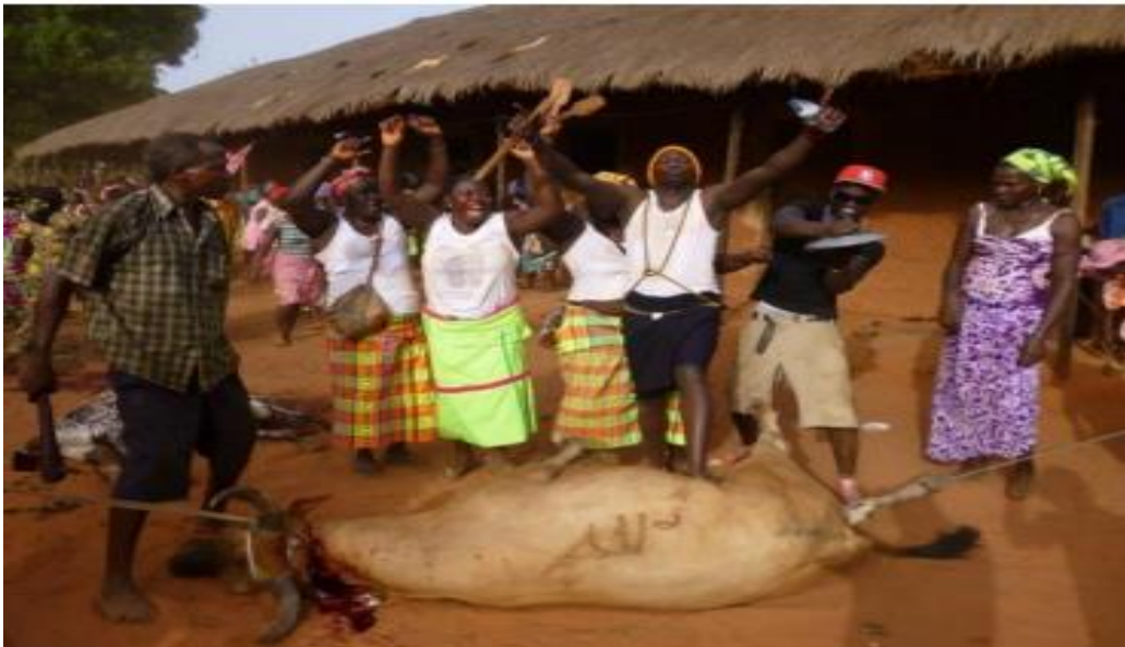
Figura 10- Ritual de Toka-Tchur realizado em memória de um pai, 2013

Em relação aos conjuntos etários as mulheres Pepel associam-se entre si em um grupo chamado de orana . Tal associação, composta por membros do mesmo gênero e da mesma faixa etária, tem como objetivo ser um espaço de acolhimento, de solidariedade e de partilha entre seus membros. Por exemplo, os membros da orana podem trocar confidências, auxiliarem uns aos outros em situações econômicas emergenciais (como despesas funerárias ou casos de doenças) e se reunir para realizar atividades lúdicas e culturais. Para custear tais ações o grupo recorre principalmente a sistemas de financiamento populares, como o abota , de tal forma que, muitas vezes, os membros de uma orana também fazem parte do mesmo grupo de abota (PIRES, 2019, p. 71).