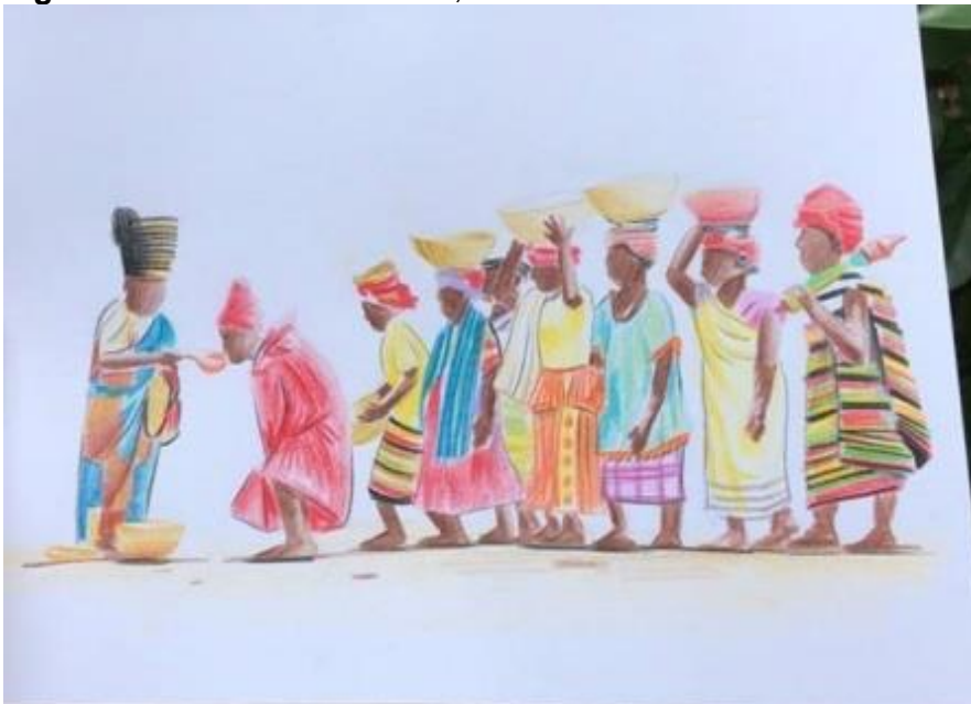
Figura 3- Ritual do Pian Kanda, 2016

Fonte: PIRES, 2021, p. 129 apud ROBIN, 2018.