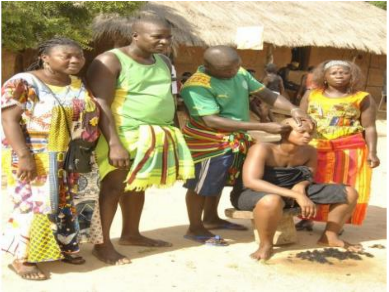
Figura 6- Amigo do marido raspando o cabelo da mulher recém-casada