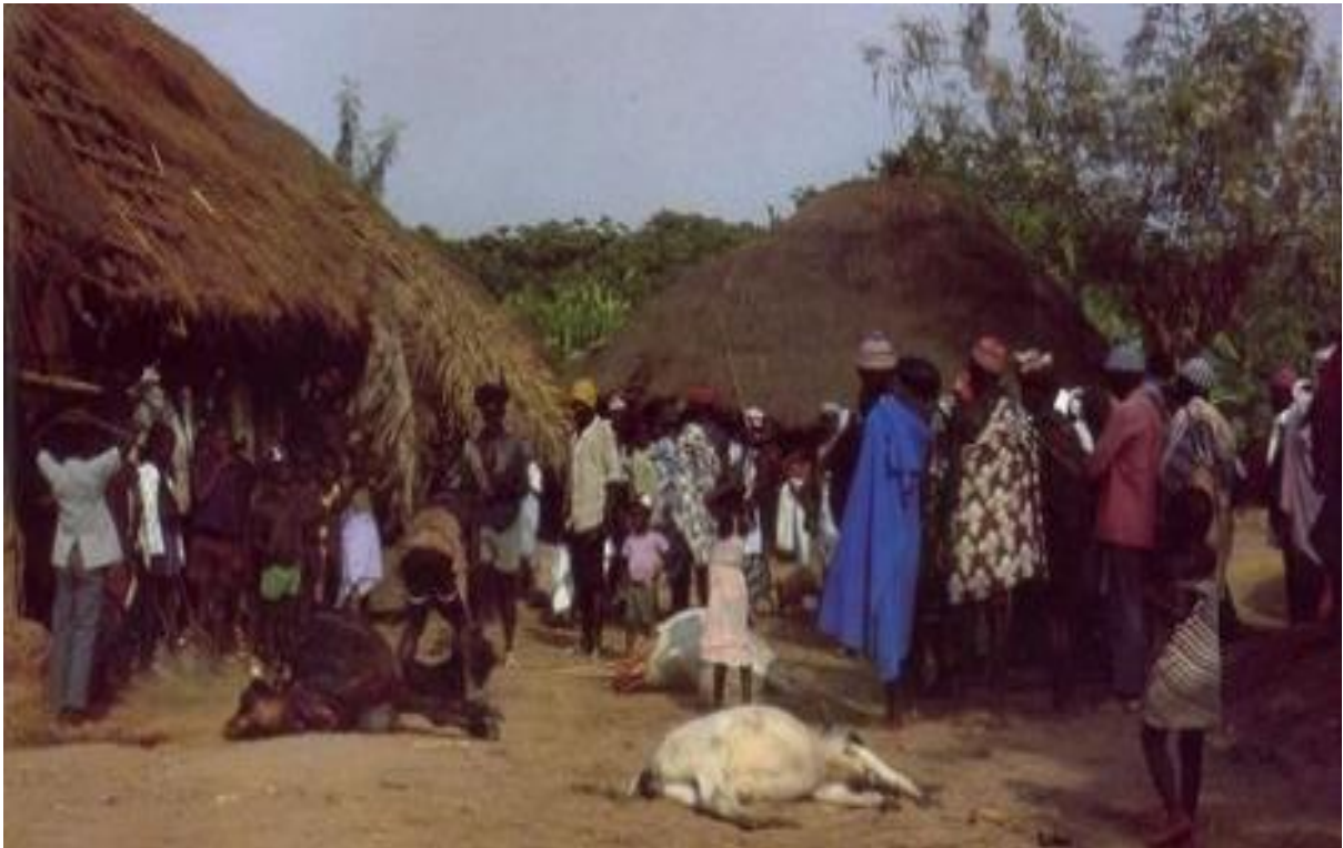
Figura 8- Lal puma de omi garandi, Pepel