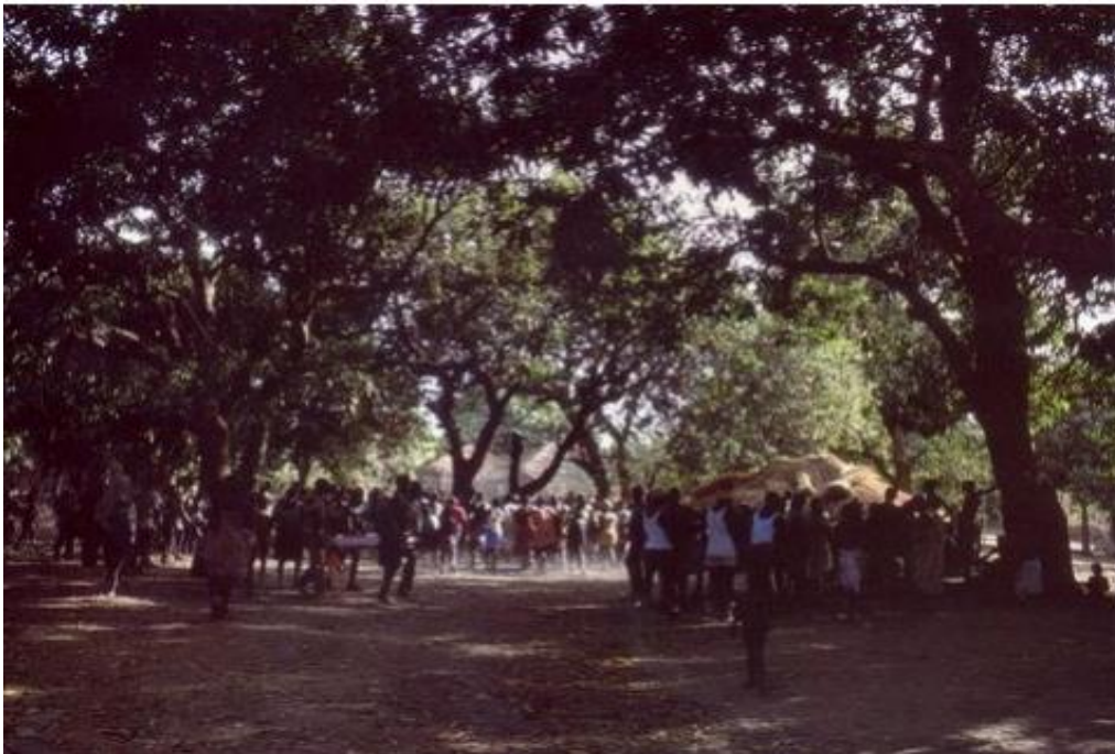
Figura 4- Cerimônia do Kansaré- tabanka de Biombo, 2014

Os testes espirituais, que constituem meios utilizados para provar a prática de um crime, consistem em: sacrifícios de animais, como galinhas ou cabras; a pessoa jura sua inocência perante o Kansaré, caso seja culpada, esta divindade o castigará; segurar uma panela, que representa o espírito. Se a pessoa for culpada pode até morrer (PIRES, 2016, p.66).