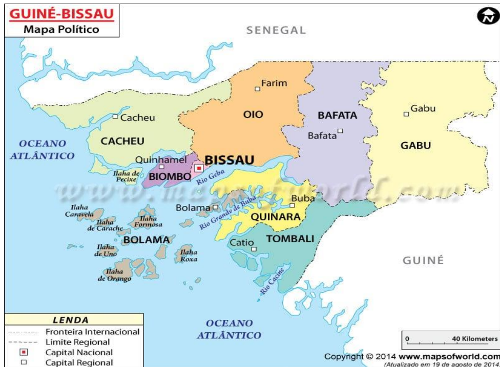
Figura 1- Mapa político da Guiné-Bissau, 2014

permite a comunicação entre os distintos grupos de povos. A língua oficial é portuguesa, porém é pouco falada. O mapa a seguir (figura 1) demonstra a localização da região de Biombo entre várias regiões que compõem a Guiné-Bissau.