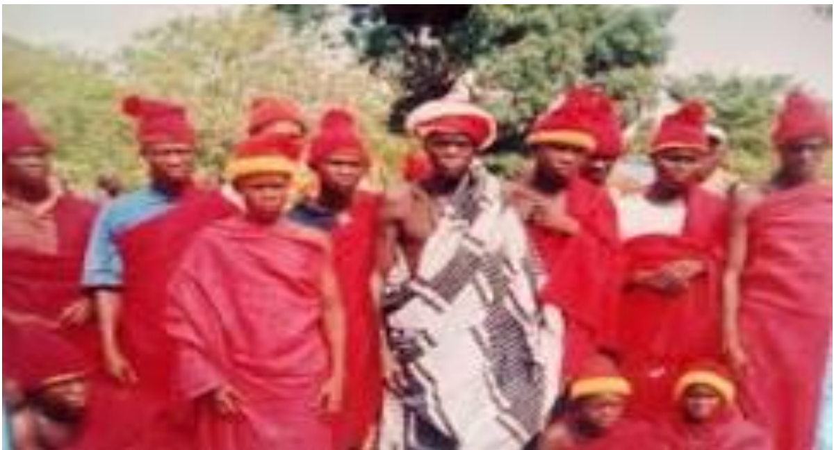
Figura 5- Fanado tradicional Pepel, Biombo