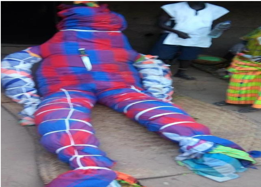
Figura 7- O defunto em público depois do último dia de vestir para sepultamento

Quando houve uma situação da morte em qualquer família da etnia papel, primeiramente eles procuram, a saber, onde vai ser o campo da cerimônia e procurar saber também de onde vem (djorson) linhagem do indivíduo, e de leva o corpo depressa para poder resolver os primeiros passos. A situação ideal é a de alguém que morre e que é de imediato levado para casa onde 21 devem decorrer as cerimônias fúnebres. Aí se realizam os ritos primários a lavagem e o embrulhamento nos primeiros panos de modo a que os rituais públicos de embrulhamento passam ter, seguidamente, lugar. (SARAIVA, 2003, p.184)