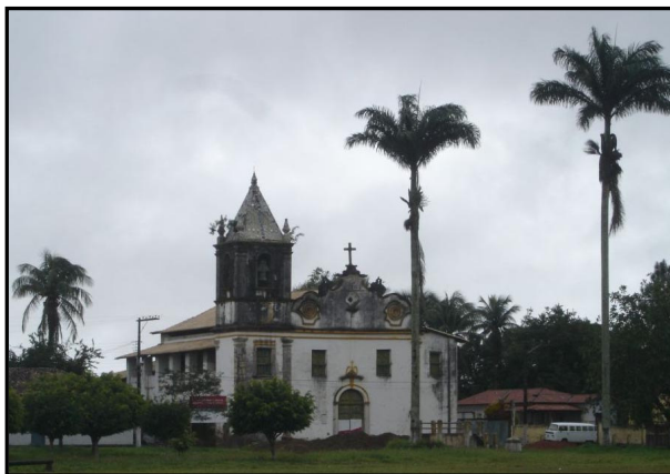
Imagem II – Igreja de Nossa Senhora de Belém. Povoado de Belém, Cachoeira – BA. 2006.

Em lugar de destaque estava assinalada a Igreja de Nossa Senhora de Belém. As mais detalhadas informações que temos da estrutura do Seminário, “os ornamentos, ouro, prata e mais alfayas, pertencentes a Igreja do Seminário de Bethlem, que foi dos Religiosos da Companhia denominada de Jesus” procedem de seu Inventário (1759-1760) (AHU, Projeto Resgate, Fundo castro e Almeida, caixa 26, doc. 4984). Esta avaliação atendia as “Reaes Ordens de El Rey Nosso Senhor” de seqüestro dos bens das Ordens Religiosas que não possuíssem licença régia, e a posterior expulsão da Companhia de Jesus na América Portuguesa (SANTOS, 2002, 69).