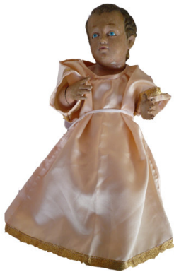
Imagem III - Menino Jesus. 17,5cm h/ 7 cm b/ 3,15 in d. (madeira), 2007.

Sagrada Família de Belém somente pudemos localizar o Menino Jesus. Contam os moradores de Belém, que não muitos anos há que arrombaram a Igreja e levaram as belas e devocionadas imagens de Nossa Senhora e seu Esposo.