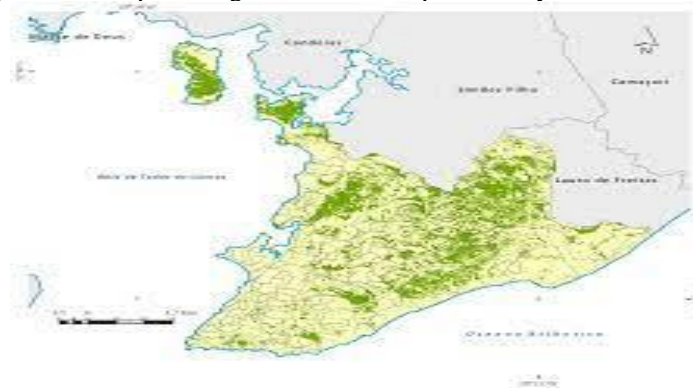
Figura 2 – Exemplo de mapa de cobertura vegetal da Cidade de Salvador Figure 1: Example of vegetation cover map of the city of Salvador